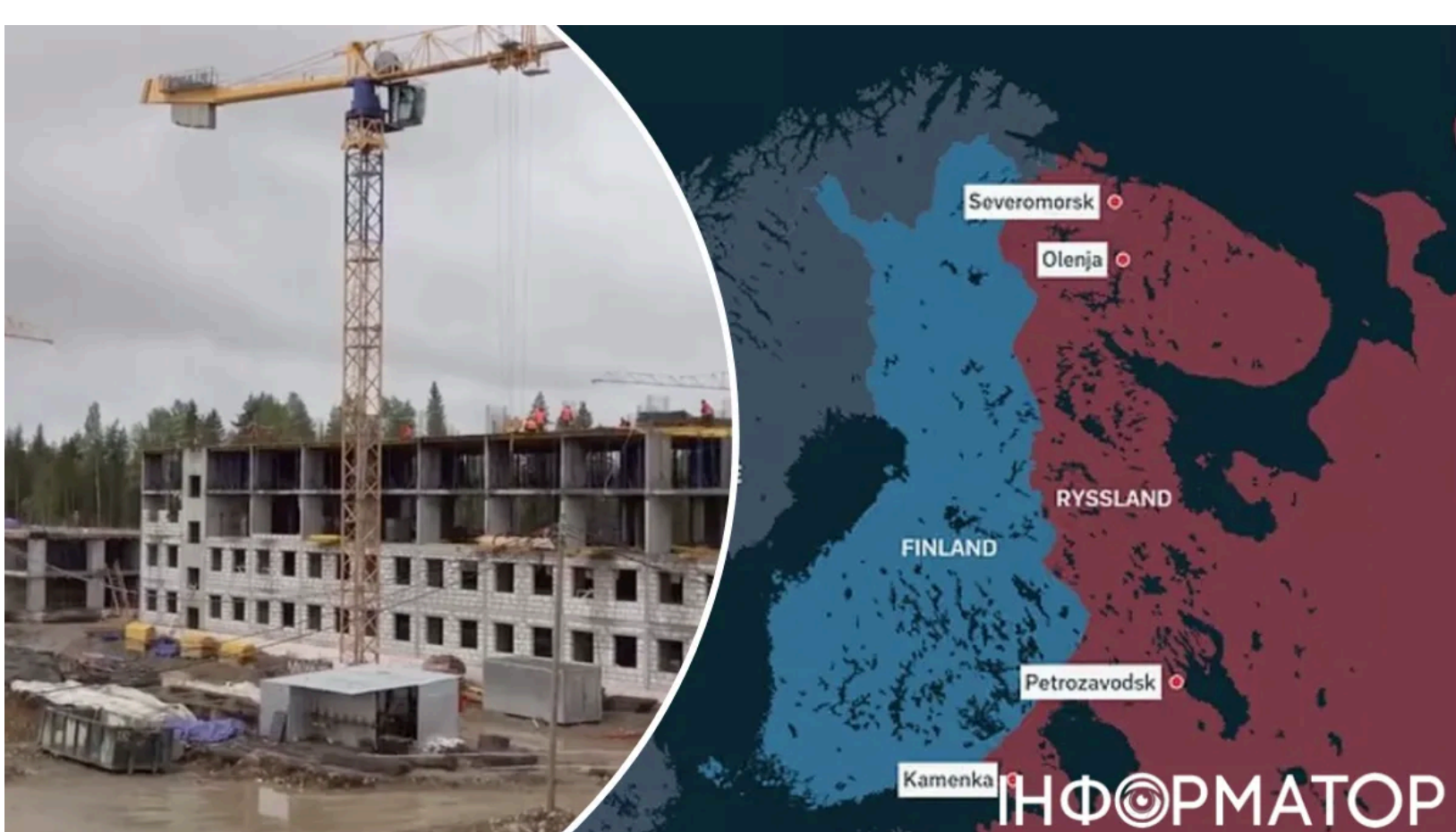
Росія будує нову базу біля Фінляндії

Росія вперше з часів Радянського Союзу зводить повністю нову військову базу поблизу кордону з Фінляндією - і робить це стрімко. Президент Фінляндії Александер Стубб, попри це, не вірить у найближчий напад РФ на Європу і закликає до переговорів. За оцінками експертів, майбутній гарнізон у селі Нова Вілга під Петрозаводськом розрахований на від 4 до 6 тисяч військовослужбовців . Будівництво вже йде повним ходом - навесні почали зводити близько десятка масштабних казармених будівель.