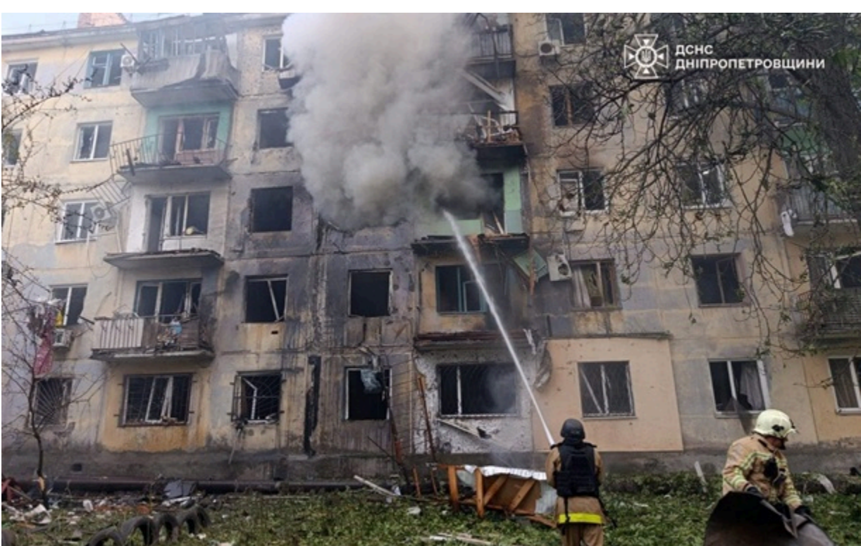
Атакований армією РФ будинок у Павлограді

Вже 12 поранених через атаку росіян по багатоповерхівці, 75-річна жінка у важкому стані.