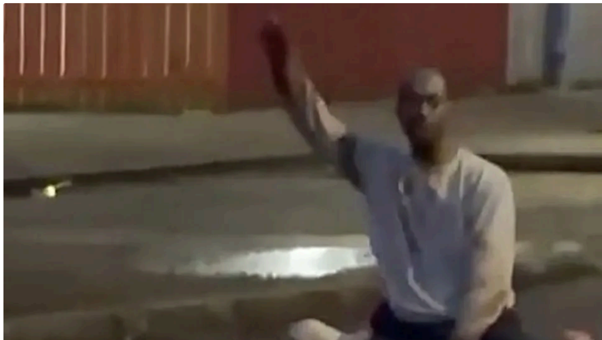
На відео видно, як темношкірий чоловік сидить зверху на потерпілому і б'є його по голові й шиї

10 червня, 22.20 🗣️ Цей матеріал також можна прочитати на русском