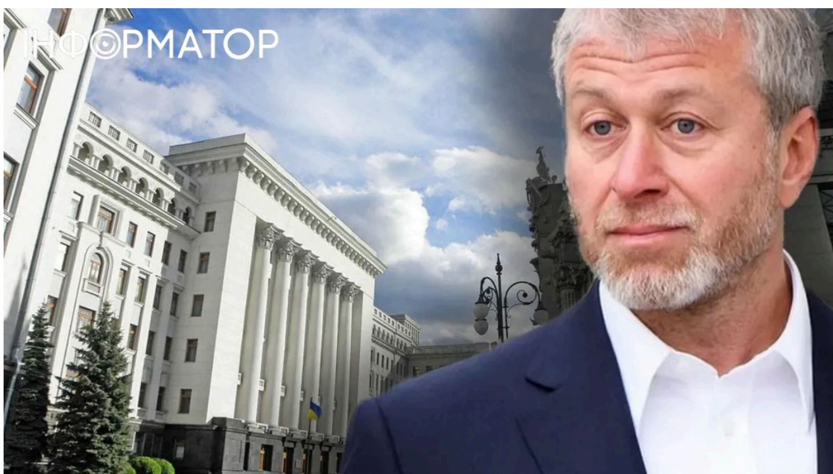
МЗС розкрило деталі візиту Абрамовича до Києва

Міністерство закордонних справ України вперше офіційно прокоментувало обставини таємного травневого приїзду російського олігарха Романа Абрамовича до Києва . Раніше Зеленський запропонував Британії спрямувати мільярди Абрамовича від "Челсі" на ППО України . Під час брифінгу речника МЗС журналісти запитали про маршрут олігарха, організаторів візиту та коло зустрічей - але отримали лише частину відповідей.