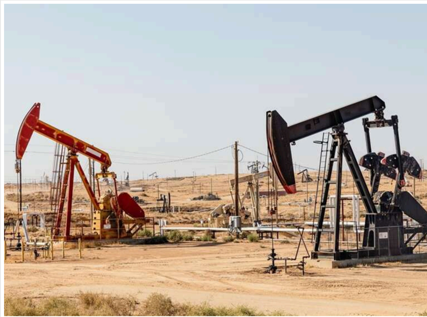
Нафта різко подорожчала після погроз Трампа завдати ударів по Ірану

Ціни на нафту різко зросли після того, як Трамп погрожував завдати по Ірану «дуже потужні удари», пише Reuters.