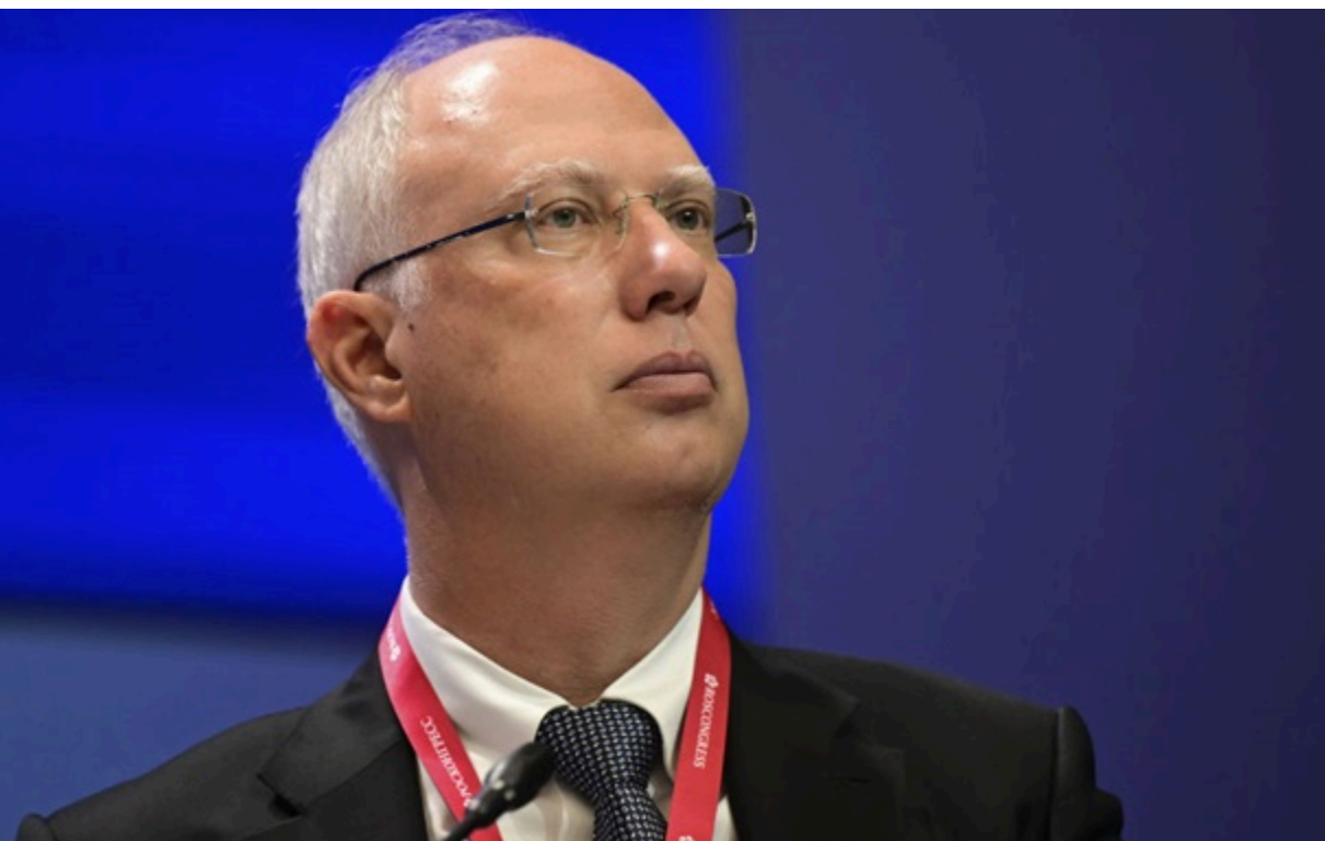
Кирило Дмитрієв є офіційним представником РФ на переговорах зі США

Кирило Дмитрієв опублікував черговий допис із критикою британського прем'єра Кіра Стармера, звернувшись цього разу до "інопланетних цивілізацій".