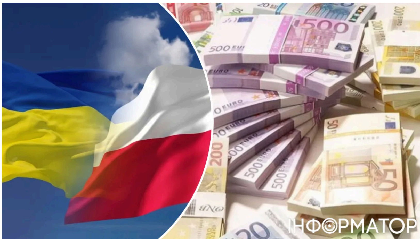
Польща і мільярди ЄС для України

Польсько-українські відносини опинилися у кризі саме тоді, коли Київ очікує на понад 6 млрд євро від Євросоюзу. Прем'єр Польщі Дональд Туск заявив, що переговори про вступ до ЄС Варшава не блокуватиме - але жодних пільг для Києва не буде . Причиною нинішньої напруги став указ президента Зеленського про присвоєння підрозділу Сил спеціальних операцій найменування "іменем Героїв УПА". Це рішення поставило під загрозу двосторонній діалог у критичний момент.