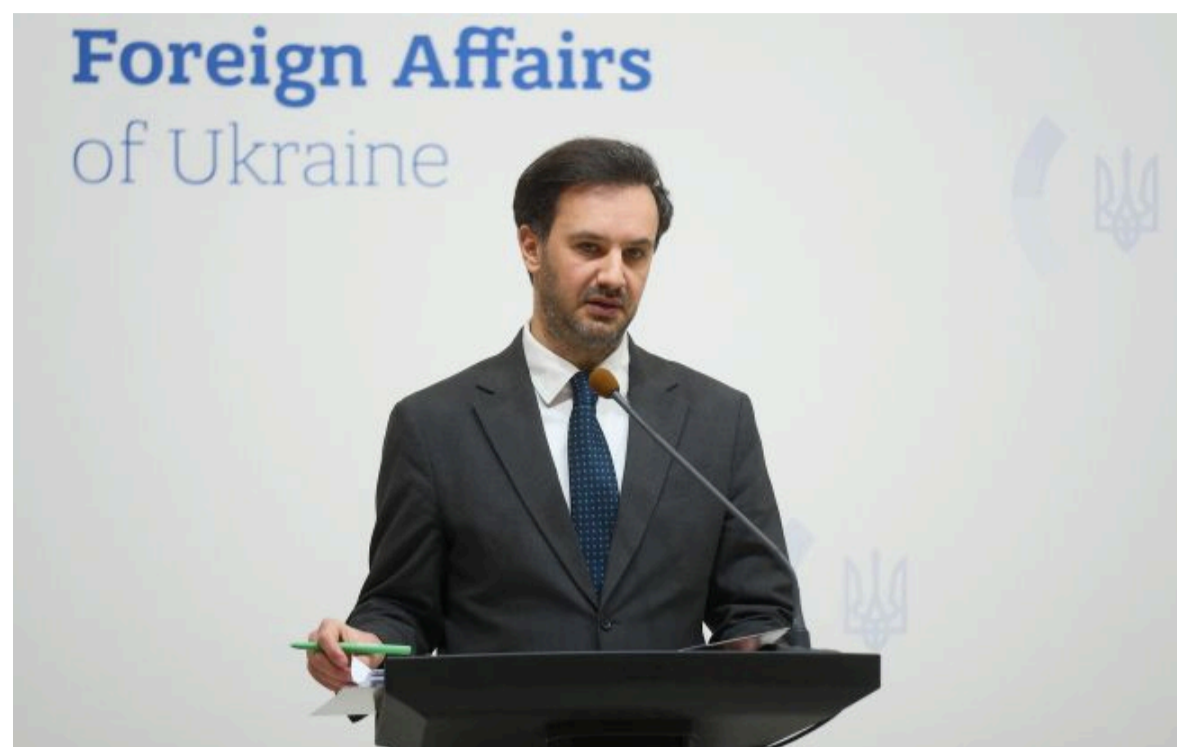
Фото: речник МЗС України Георгій Тихий (Віталій Носач, РБК-Україна)