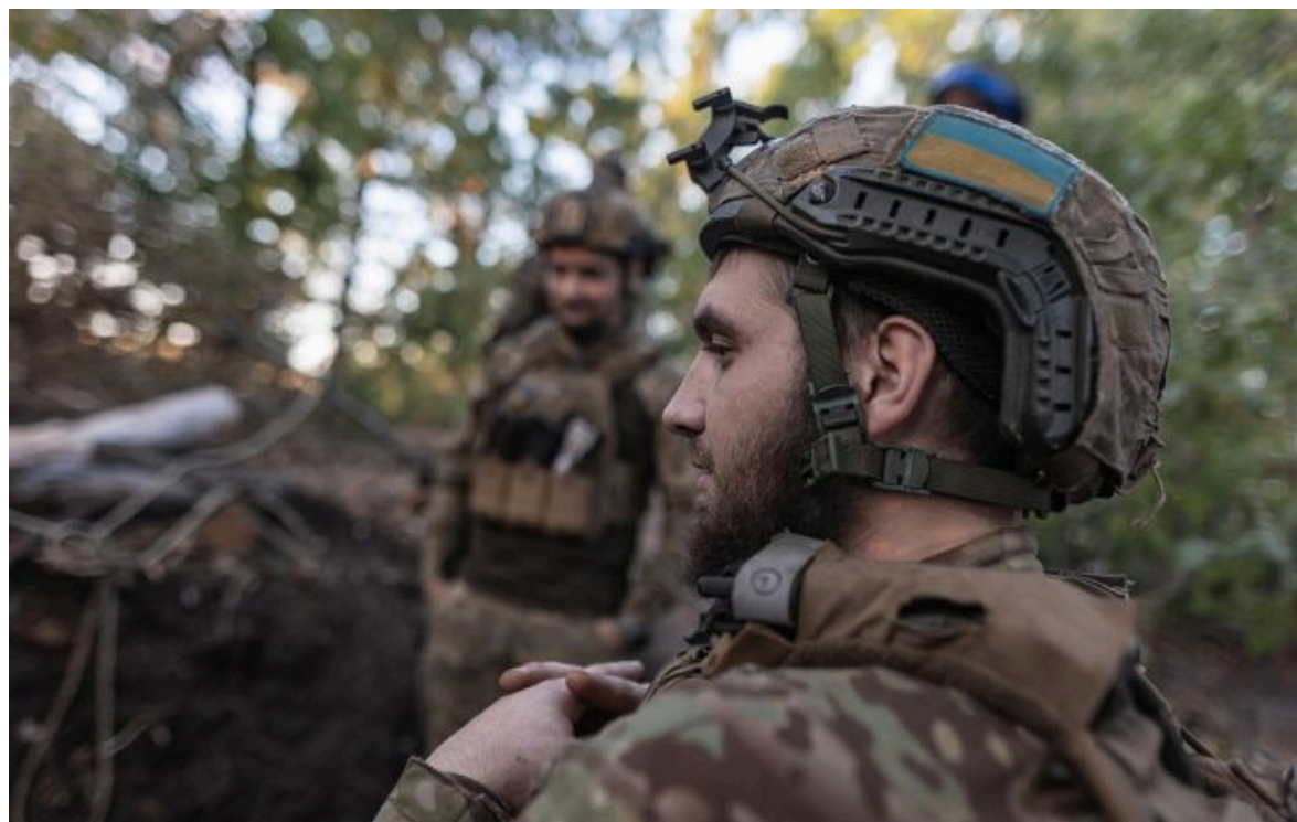
Фото: українські військові