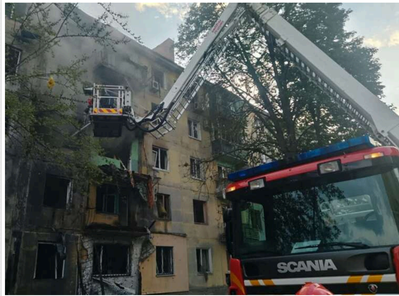
Удар по Павлограду: у місті пошкоджено промислове підприємство та житловий будинок

Унаслідок удару по Павлограду пошкоджено промислове підприємство та прилеглі будівлі.