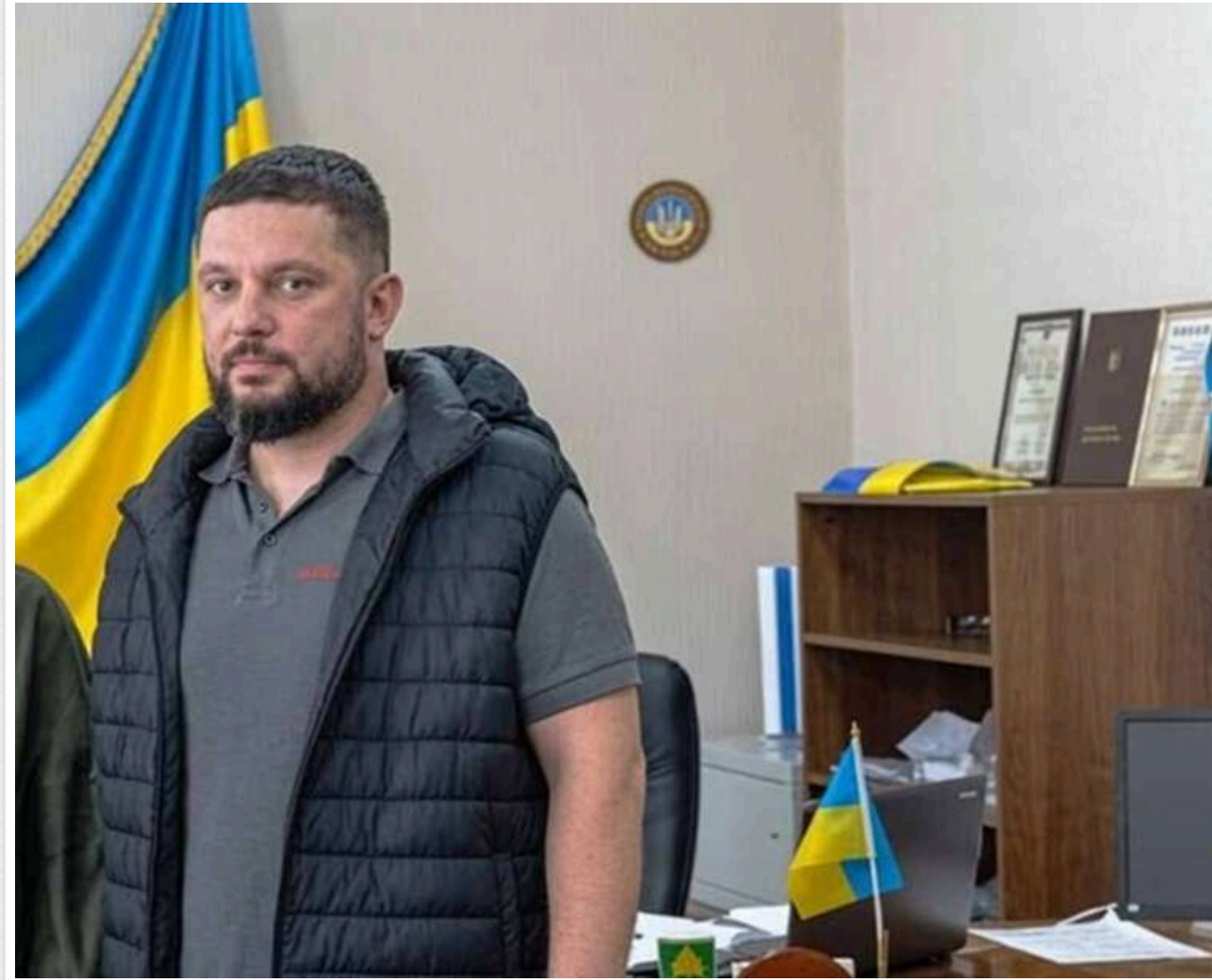
«Імунітет» від мобілізації та продаж гуманітарки: в Одеській області викрили схему ексголови ТЦК Данієляна

Читати на русском Read in English Додати як бажане джерело в Google