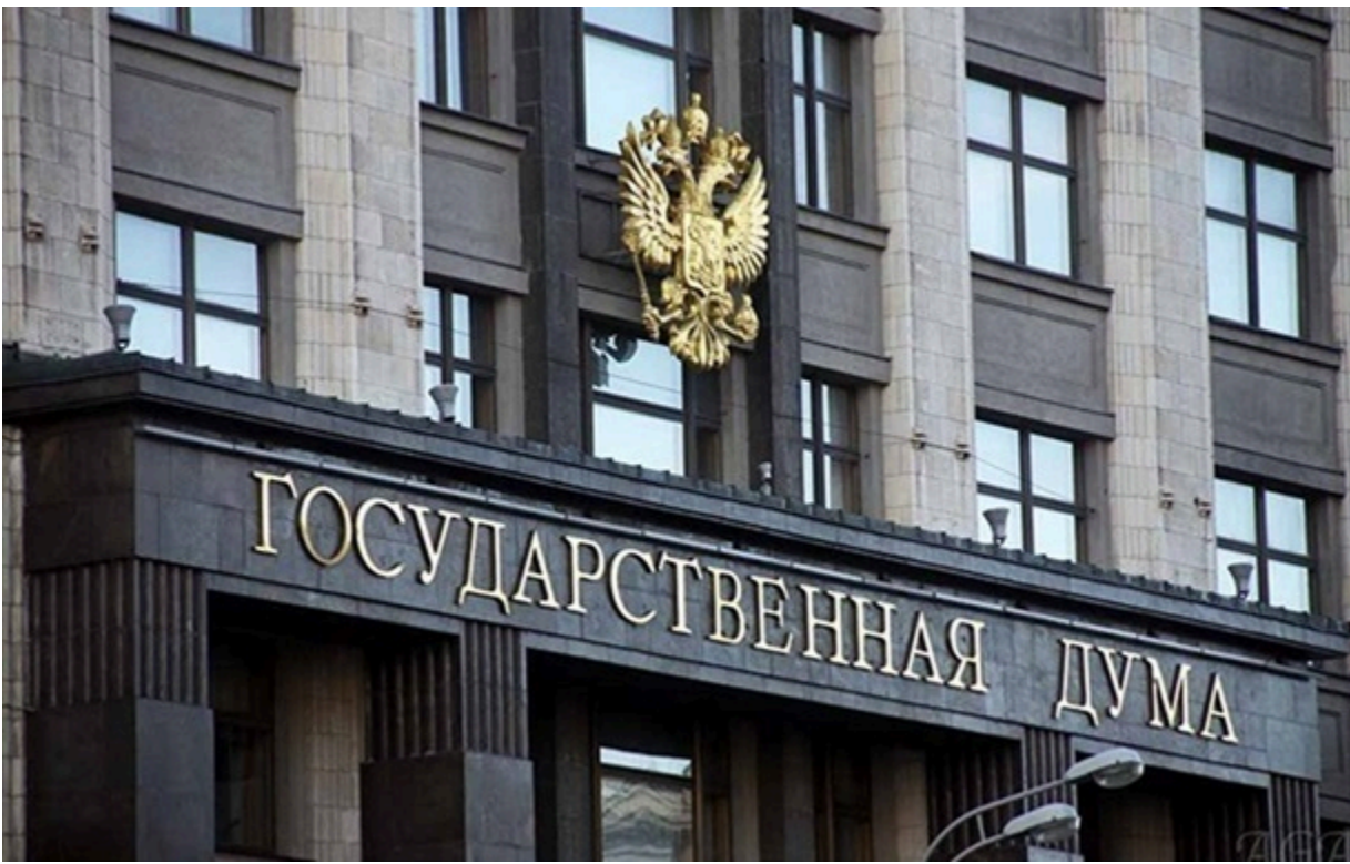
Держдума оголосила про заборону обладнання для супутникового інтернету Starlink

У Росії намагаються створити власні супутникові системи зв'язку. Зокрема, компанія "Бюро 1440" розвиває проєкт "Рассвет", який називають російським аналогом Starlink.