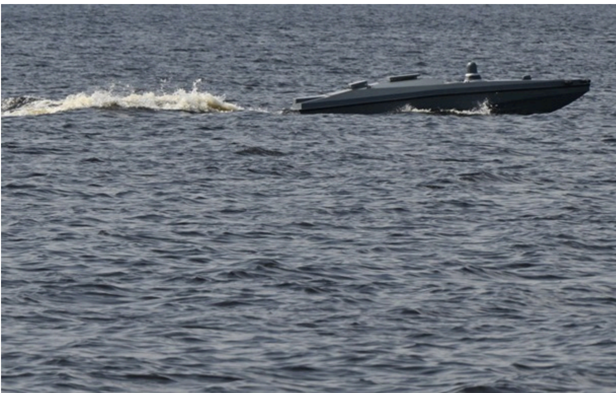
Морський дрон врятував екіпаж збитого американського гелікоптера

Після збиття, пілоти близько двох годин дрейфували у водах біля узбережжя Оману.