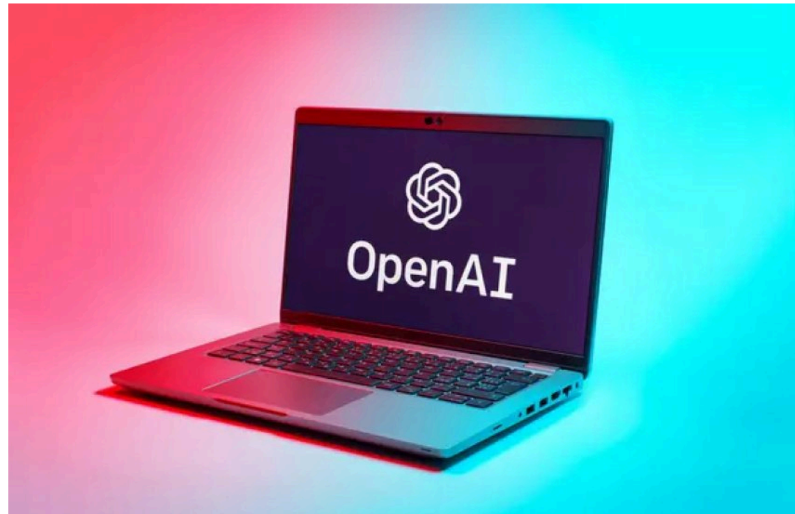
OpenAI планує орендувати гігантський дата-центр за підтримки Nvidia та SoftBank

Американська компанія OpenAI веде переговори про оренду запланованого кампусу дата-центру потужністю 10 гігават на федеральній землі в штаті Огайо. Угода може містити фінансову підтримку з боку технологічного гіганта Nvidia.