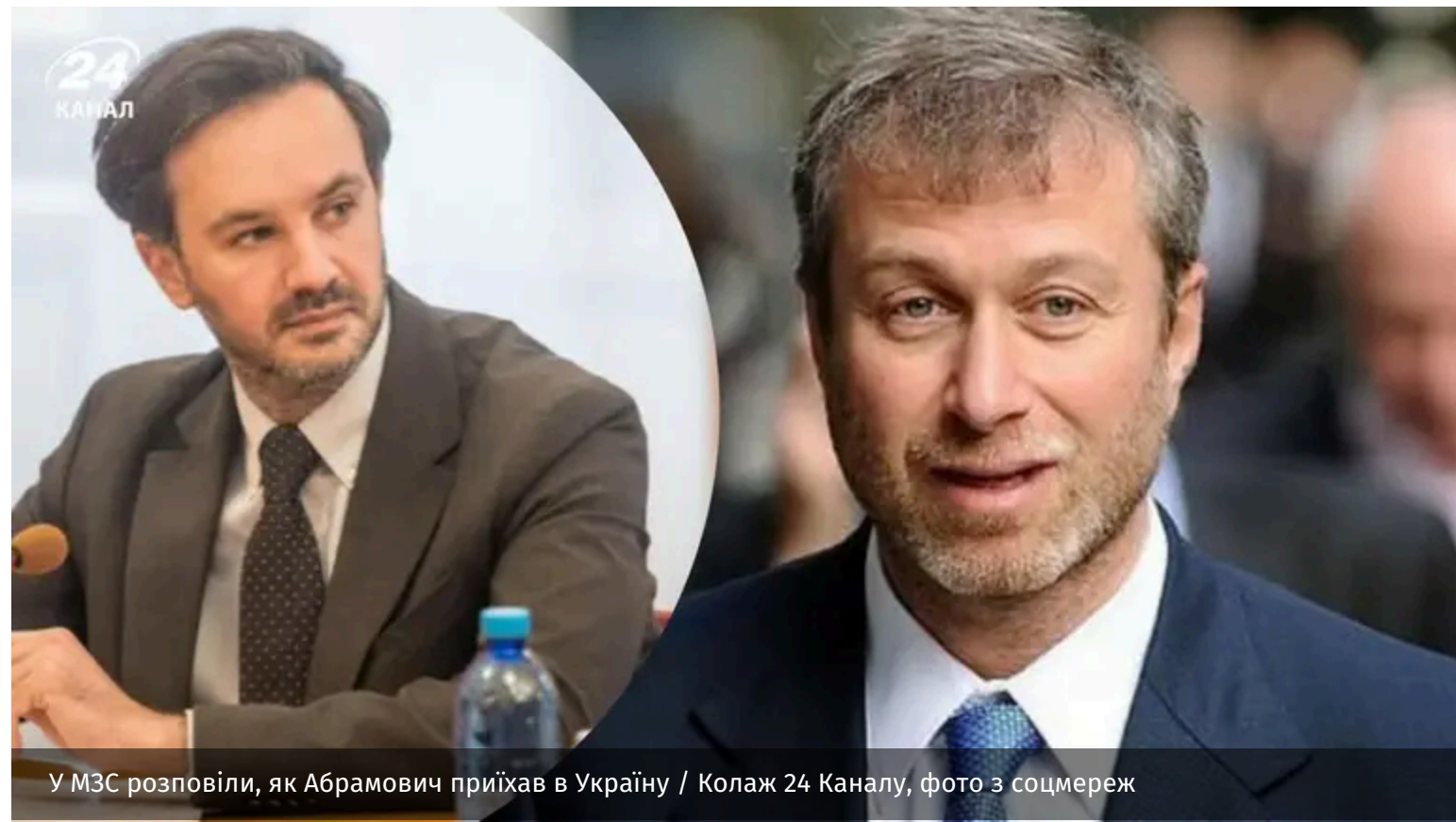
У МЗС розповіли, як Абрамович приїхав в Україну

Речник МЗС Георгій Тихий розповів про візит до Києва російського олігарха Романа Абрамовича. Він наголосив, що уряд України готовий використати будь-які контакти для наближення миру.