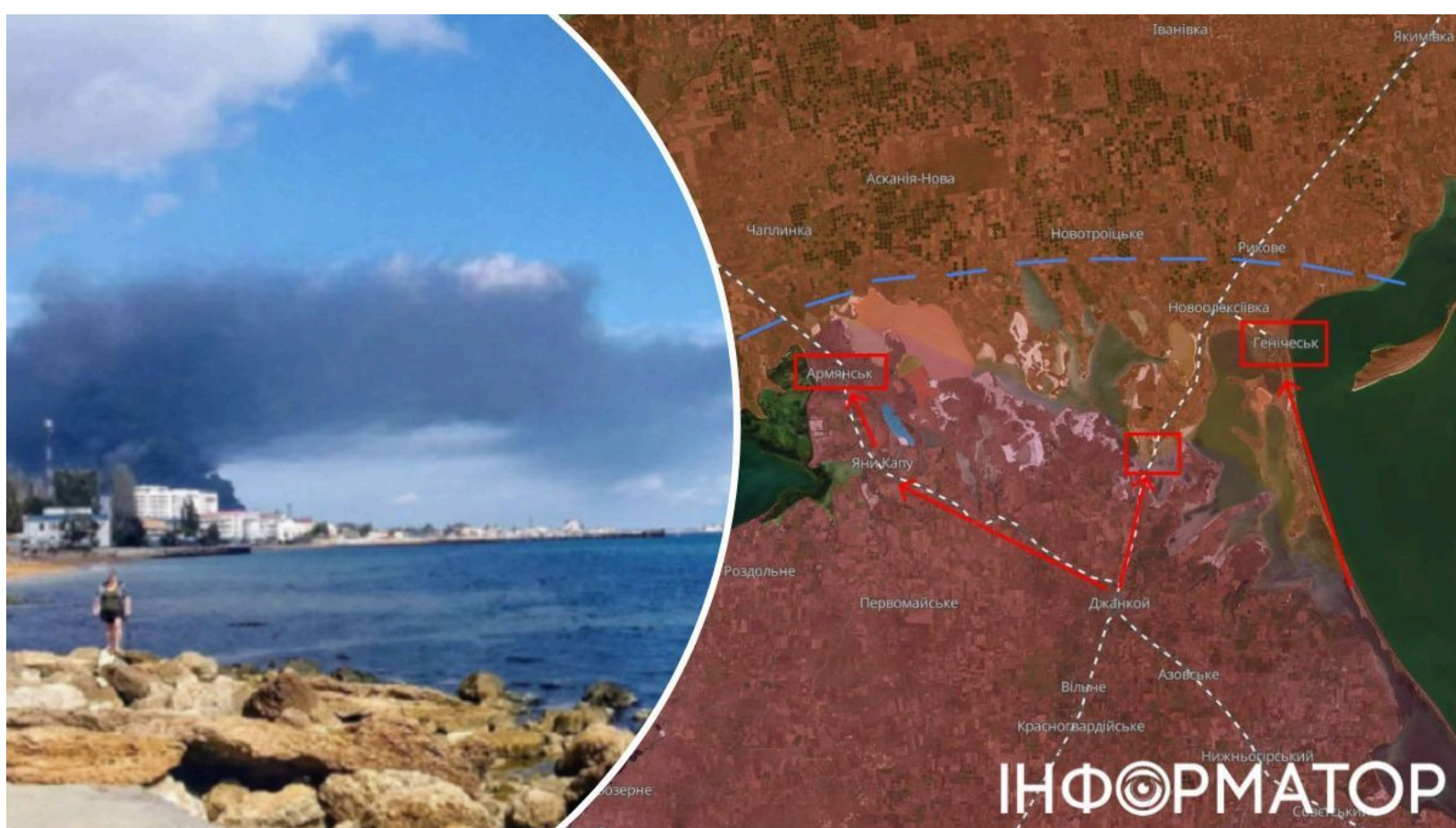
DeepState пояснив блокаду півдня України

Сили оборони України поступово перетворюють окупований південь країни на логістичну пастку для російського угруповання . Аналітики зафіксували два точні ураження автомобільного мосту в районі Чонгара на новозбудованій трасі Р-280, яка з'єднує Ростов-на-Дону з окупованим Сімферополем. Унаслідок першого удару рух до Криму через пункт пропуску "Джанкой" було тимчасово припинено, а транспортні потоки перенаправили через Армянськ і Перекоп. 9 червня Сили оборони вдарили по Чонгарському мосту повторно, через що рух ним знову перекрили.