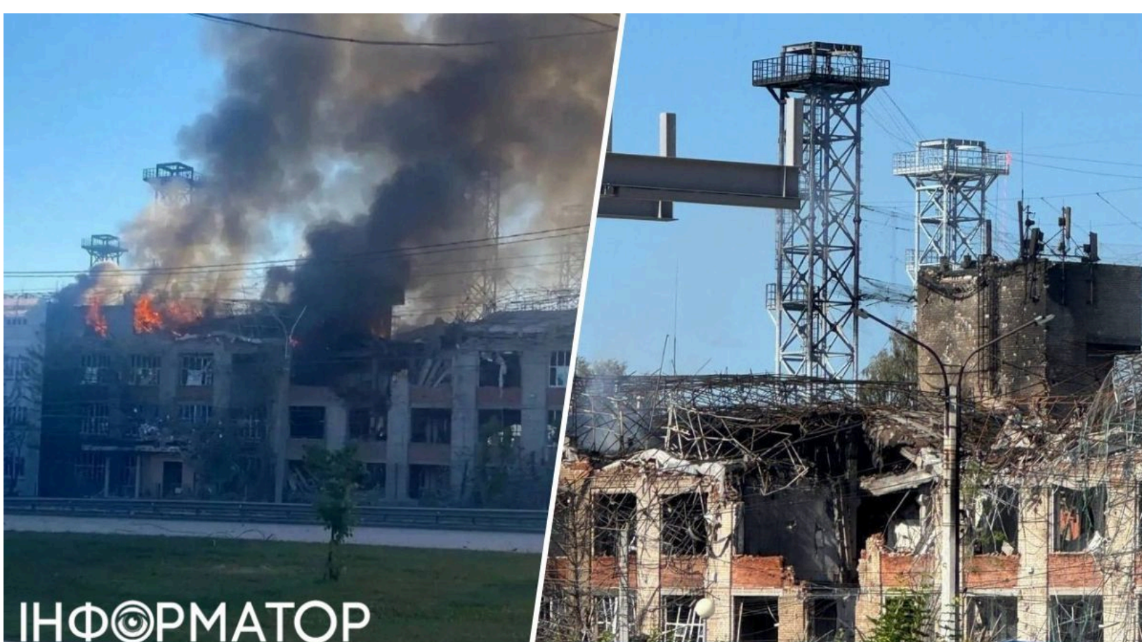
Завод у Чебоксарах зруйнований після удару "Фламінго".

Перші супутникові знімки зафіксували масштаб руйнувань на оборонному заводі "ВНИИР-Прогресс" у Чебоксарах після удару українських ракет FP-5 "Фламінго" вночі 10 червня. Завод у Чебоксарах виробляє для армії РФ ключові навігаційні компоненти для дронів і ракет. Раніше Сили оборони вже завдали аналогічного удару по найбільшому арсеналу ракет ГРАУ у Волгоградській області, де зафіксували вторинну детонацію. Президент Володимир Зеленський назвав удар "далекобійними санкціями" проти воєнної промисловості ворога.