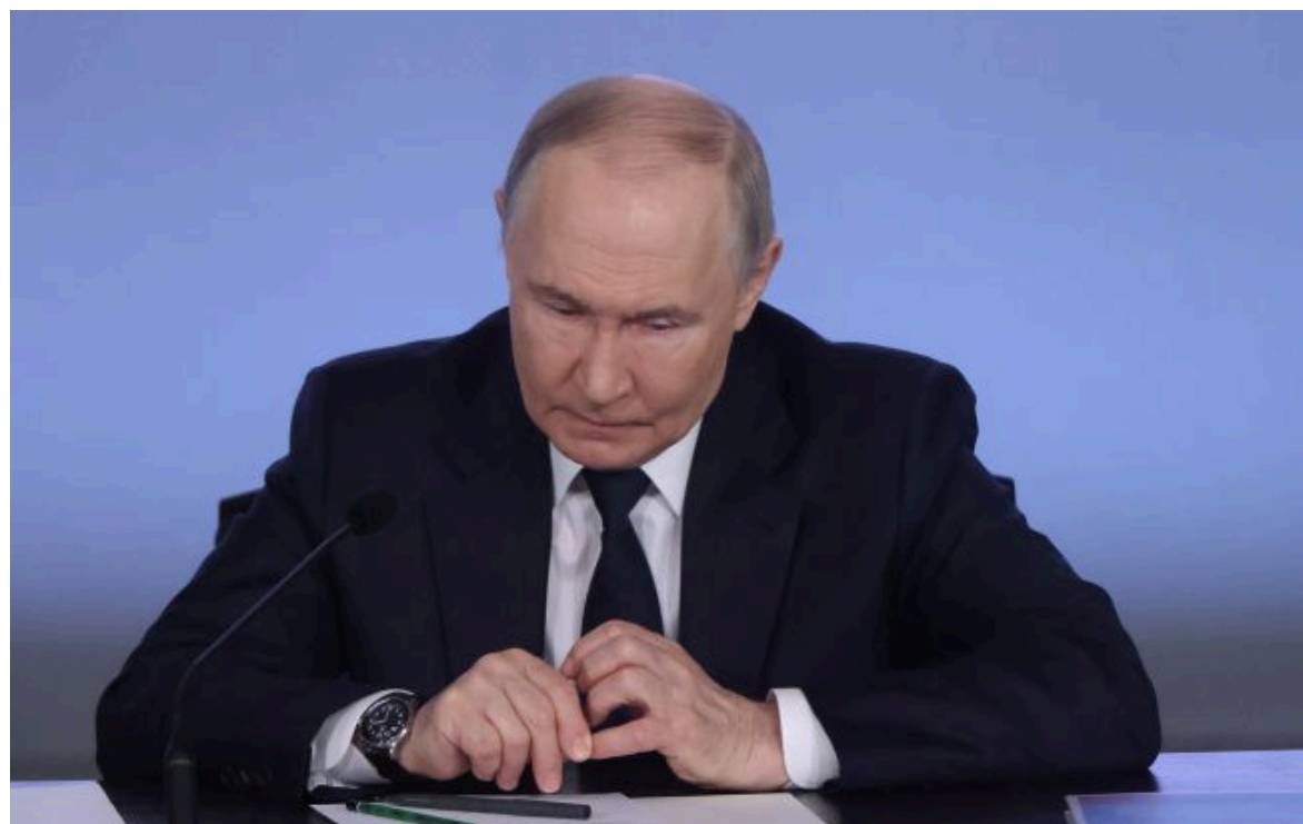
Фото: російський диктатор Володимир Путін