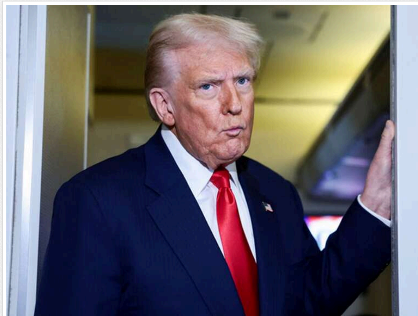
"У нас є право це робити": Трамп погрожує відновити бомбардування Ірану

Трамп пригрозив відновити бомбардування Ірану у відповідь на збитий американський вертоліт.