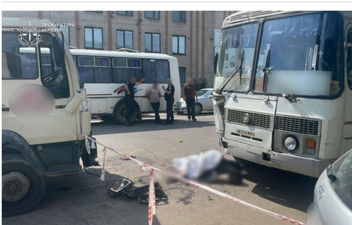
На Закарпатті вантажівка в'їхала у людей, які виходили з автобуса

Внаслідок зіткнення одна жінка загинула на місці події. Ще трьох потерпілих із тілесними ушкодженнями госпіталізували до районної лікарні.