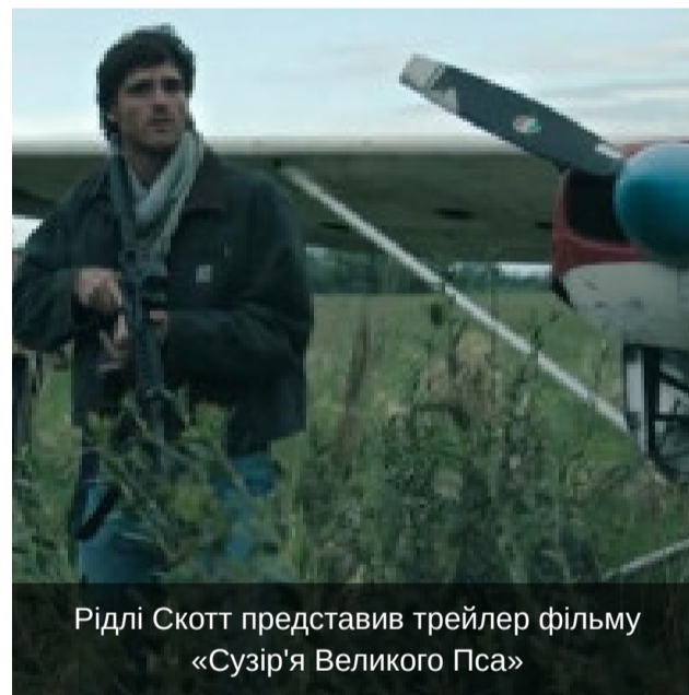
Фото та Відео

Рідлі Скотт представив трейлер фільму «Сузір'я Великого Пса»