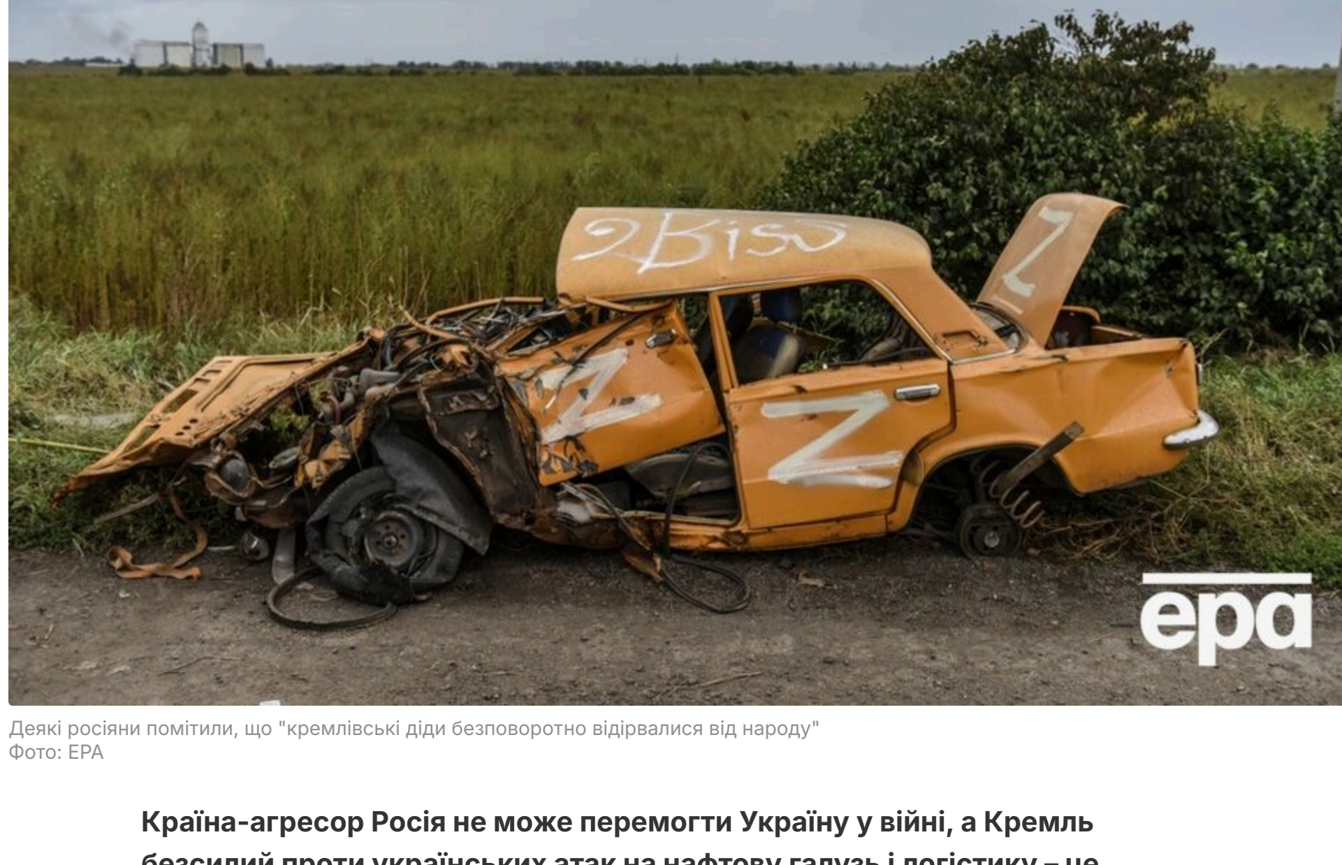
Декор рослин помилки, що "кременівські діди безповоротно відірвалися від народу".

Країна-агресор Росія не може перемогти Україну у війні, а Кремль безсилли проти українських атак на нафтову галузь і логістику – це визнають уже навіть найзапекліші ватники, Z-блогери та "воєнкори", а також деякі російські політики і чиновники. Видання "ГОРДОН" відкриває не регулярну, але пріємну рубрику "Виття на болотах": тут була перша серія скиглення російських пропагандистів, сьогодні – друга.