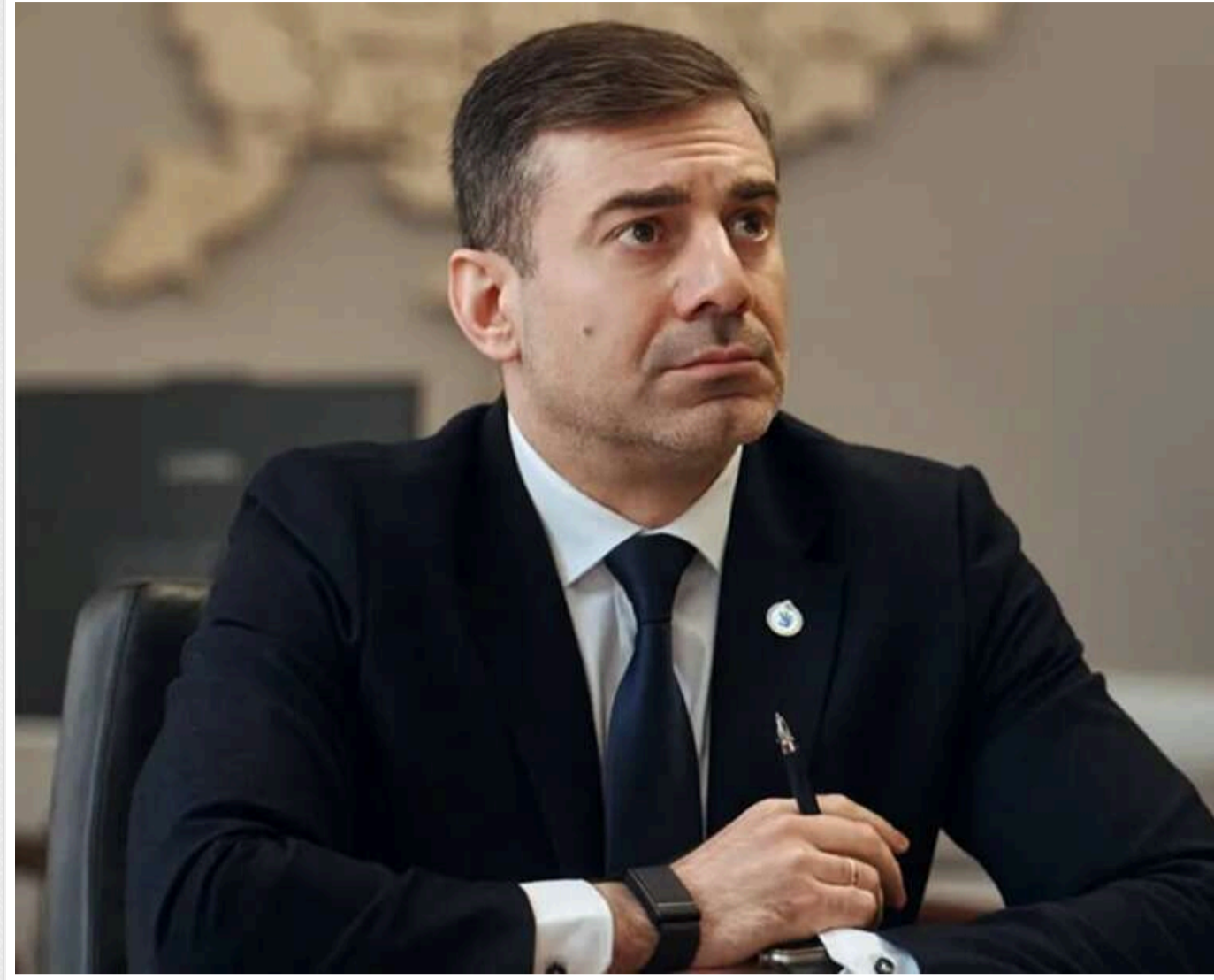
Мав пропозицію про співпрацю: Лубінець пояснив, навіщо йому телефонував Єрмак після звільнення з ОП

Уповноважений Верховної Ради України з прав людини Дмитро Лубінець повідомив, що колишній керівник Офісу Президента Андрій Єрмак після звільнення з посади телефонував йому з пропозицією про співпрацю.