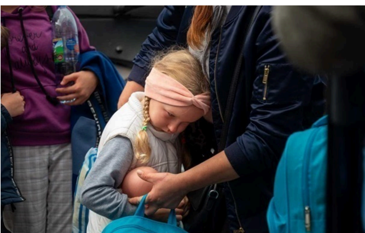
Зросла кількість українців з тимчасовим захистом в ЄС

У квітні в ЄС перебувало близько 4,37 мільйона українців із статусом тимчасового захисту, що на 1% більше, ніж у березні 2026 року.