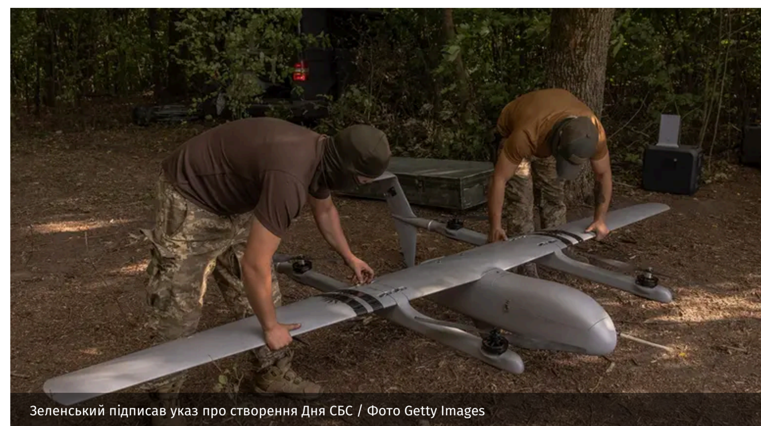
Зеленський підписав указ про створення Дня СБС

Президент України постановив відзначати День Сил безпілотних систем 11 червня. Він обґрунтував своє рішення започаткуванням нових військових традицій.