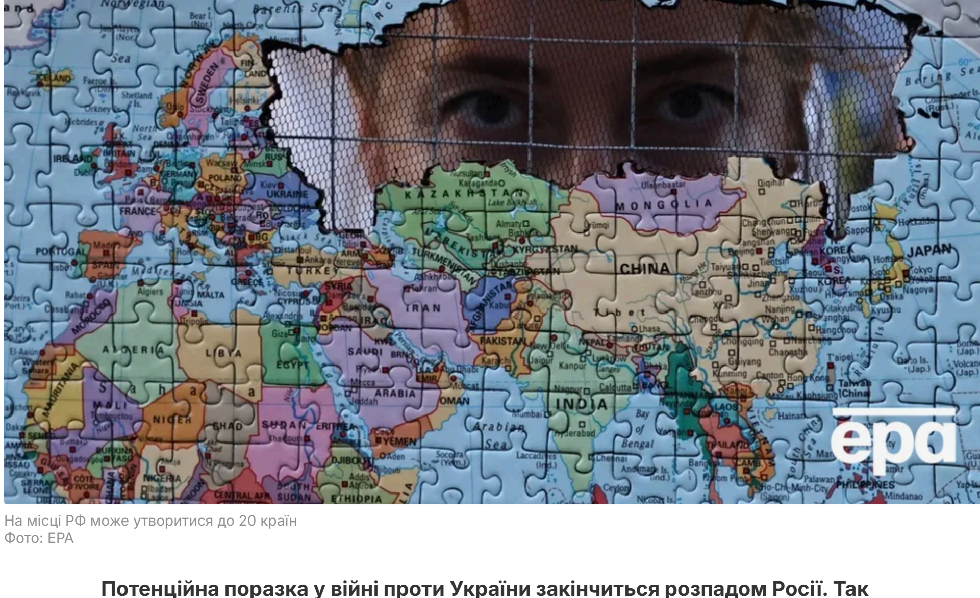
На місці РФ може утворитися до 20 країн

10 червня, 17:17 Этот материал также можно прочитать на русском