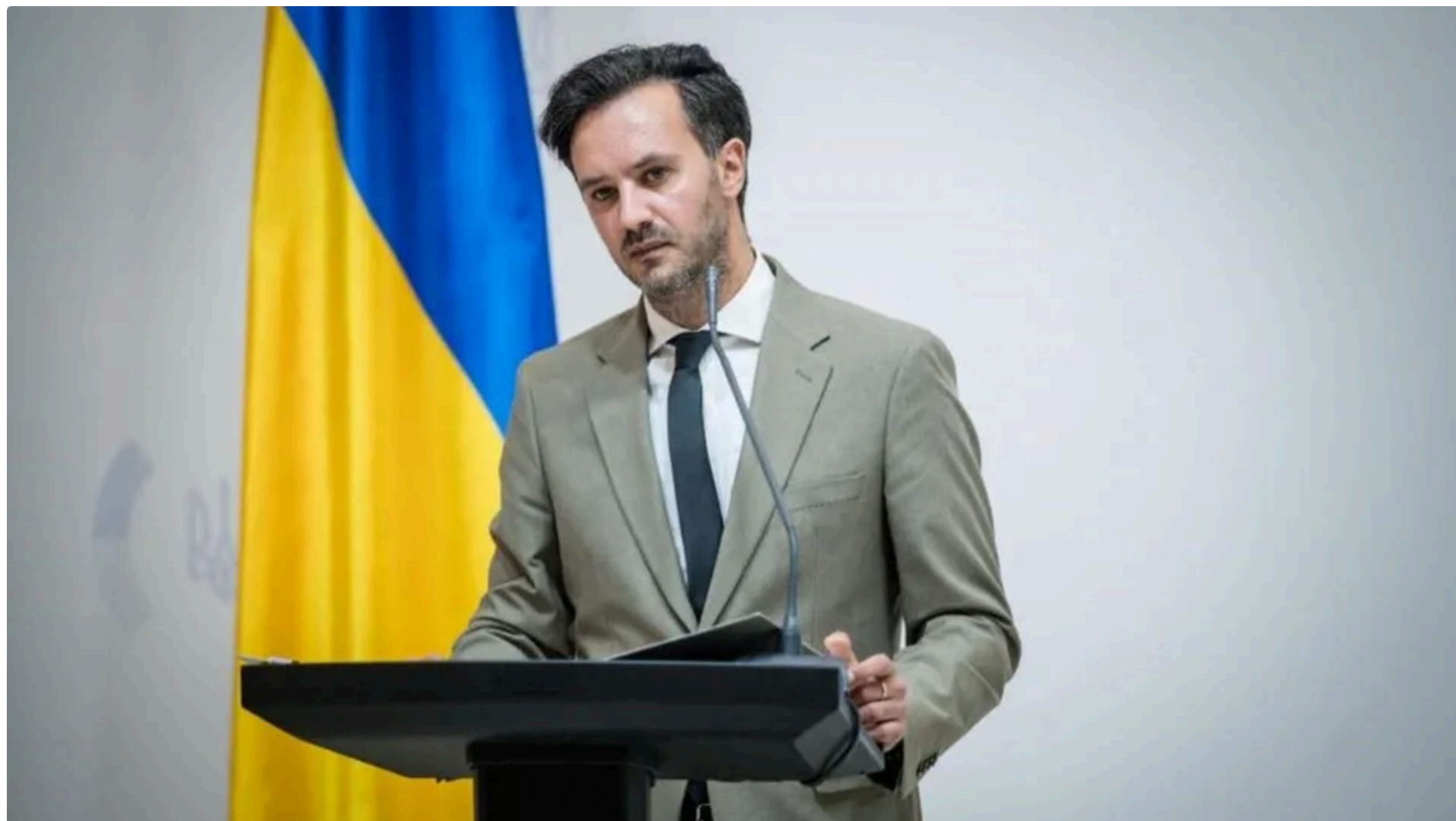
Тихий зазначив, що спосіб поїздки Абрамовича в Україну не має принципового значення

10 червня, 18.43 🗨️ Цей матеріал також можна прочитати на русском