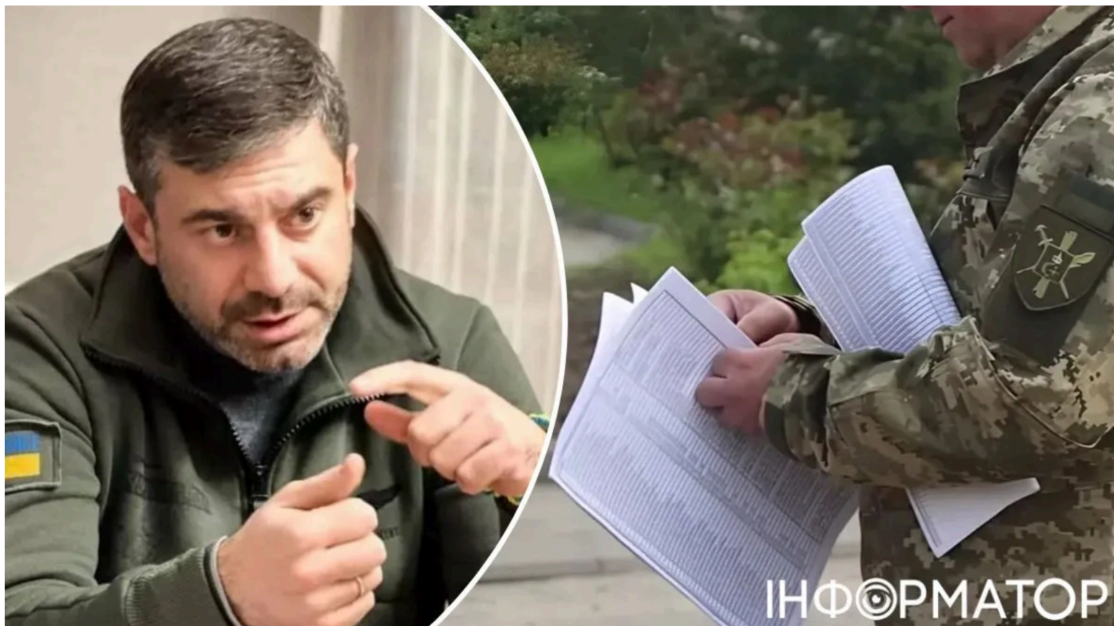
Лубінець каже, що кількість скарг на ТЦК тільки збільшується

Уповноважений Верховної Ради з прав людини Дмитро Лубінець заявив, що лише за п'ять місяців 2026 року до його офісу надійшло понад три тисячі скарг на дії працівників ТЦК - це вже більше половини від загального числа звернень за весь минулий рік. Кількість реальних порушень може бути мінімум утричі більшою, ніж зафіксовано офіційно. Таку практику омбудсман назвав "системою беззаконня" і "вседозволеності". Тих, хто може відкупитися, відпускають, а мобілізують нерідко всіх підряд - зокрема людей, які можуть бути непридатними до служби.