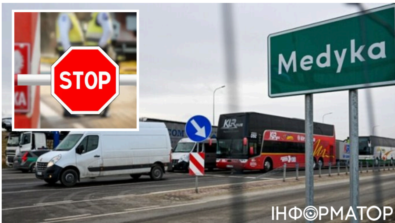
Шегині-Медика закриває автобусний виїзд до 2027

Виїзд автобусів з України до Польщі через один із найпопулярніших прикордонних переходів призупиняється майже на півтора року. Черги на "Шегинях" сягали десятків автомобілів, а сезонний приріст пасажиропотоку традиційно посилює навантаження на КПП . Тепер пасажиром і перевізникам доведеться перебудувувати маршрути на тривалий час.