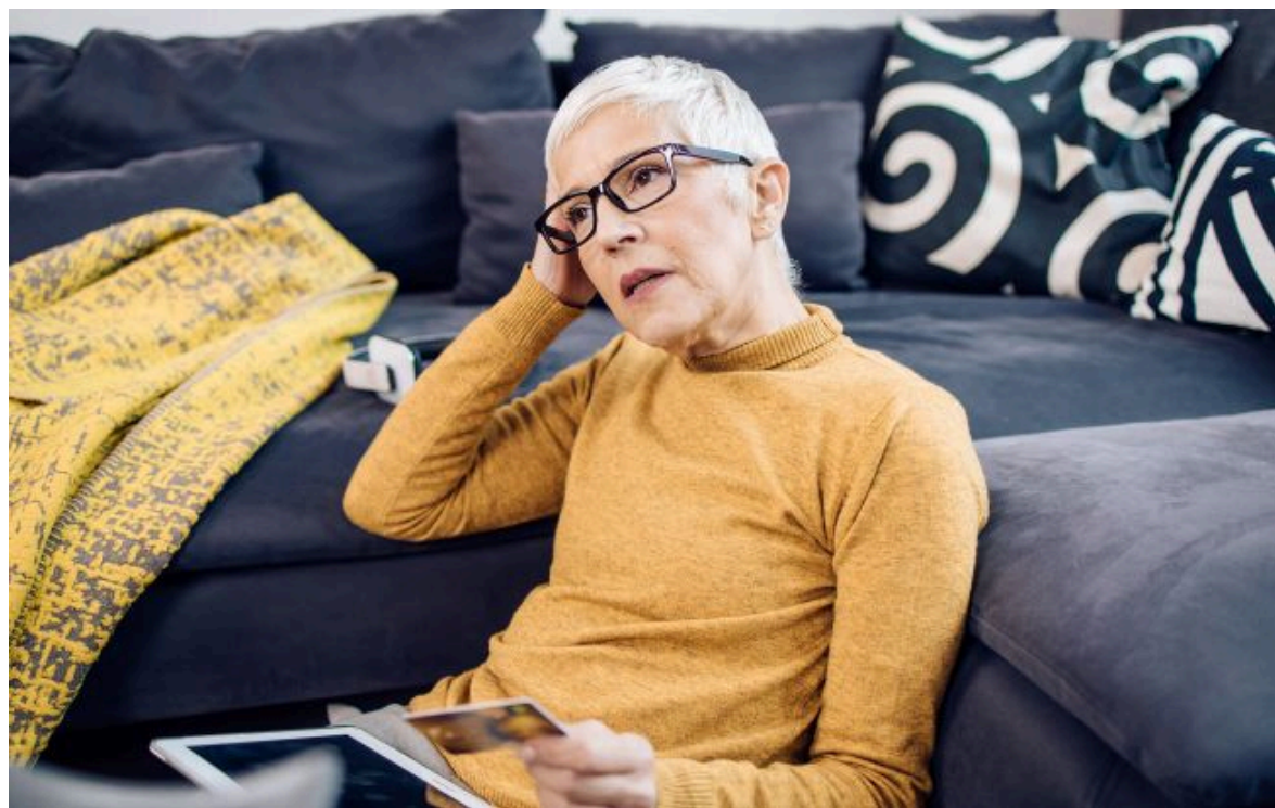
Фото: Які ще документи треба оцифрувати для пенсії (Getty Images)