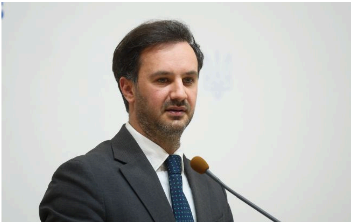
Фото: речник МЗС України Георгій Тихий