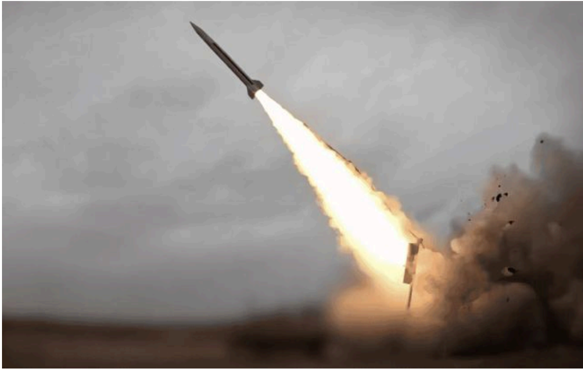
Фото: Fire Point випробувала ППО Freya проти балістики (скрін відео)

Розумій ситуацію на фронті через факти, а не чутки з РБК-Україна у Google