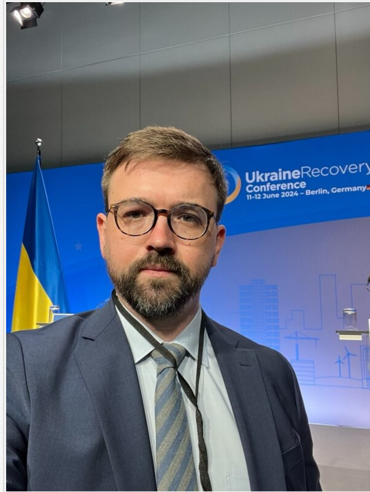
Схема виглядає як класичний приклад тінювого впливу: перебуваючи в наглядовій раді системного оператора, зберігати контроль, кабінет і авто в розподільчих мережах під прикриттям статусу радника міністра та водночас спрямовувати державні підприємства до спілки свого соратника.

Тієї самої, яку очолює Олександр Баранюк — його давній колега за попереднім складом Наглядової ради «Укренерго».