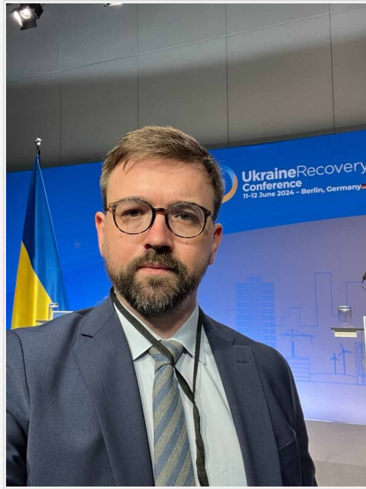
Схема виглядає як класичний приклад тінювого впливу: перебуваючи в наглядовій раді системного оператора, зберігати контроль, кабінет і авто в розподільчих мережах під прикриттям статусу радника міністра та водночас спрямовувати державні підприємства до спілки свого соратника.