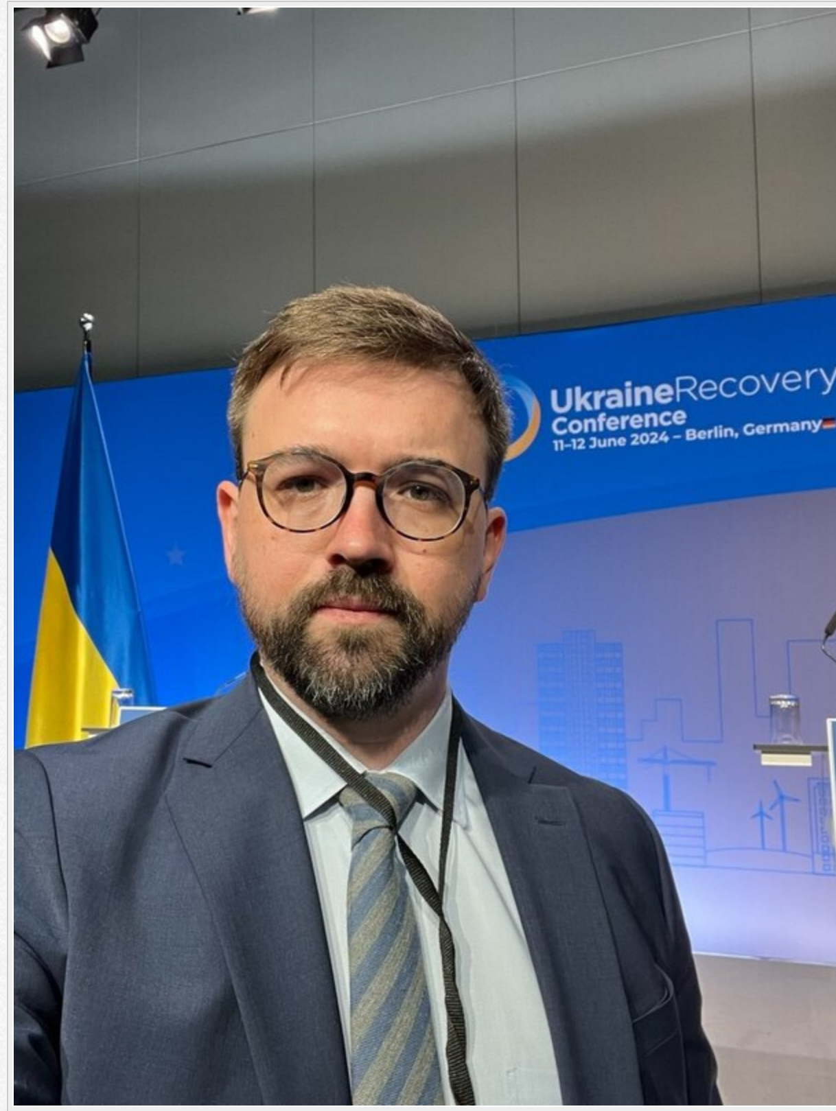
Схема виглядає як класичний приклад тінювого впливу: перебуваючи в наглядовій раді системного оператора, зберігати контроль, кабінет і авто в розподільчих мережах під прикриттям статусу радника міністра та водночас спрямовувати державні підприємства до спілки свого соратника.

Тієї самої, яку очолює Олександр Баранюк – його давній колега за попереднім складом Наглядової ради «Укренерго».