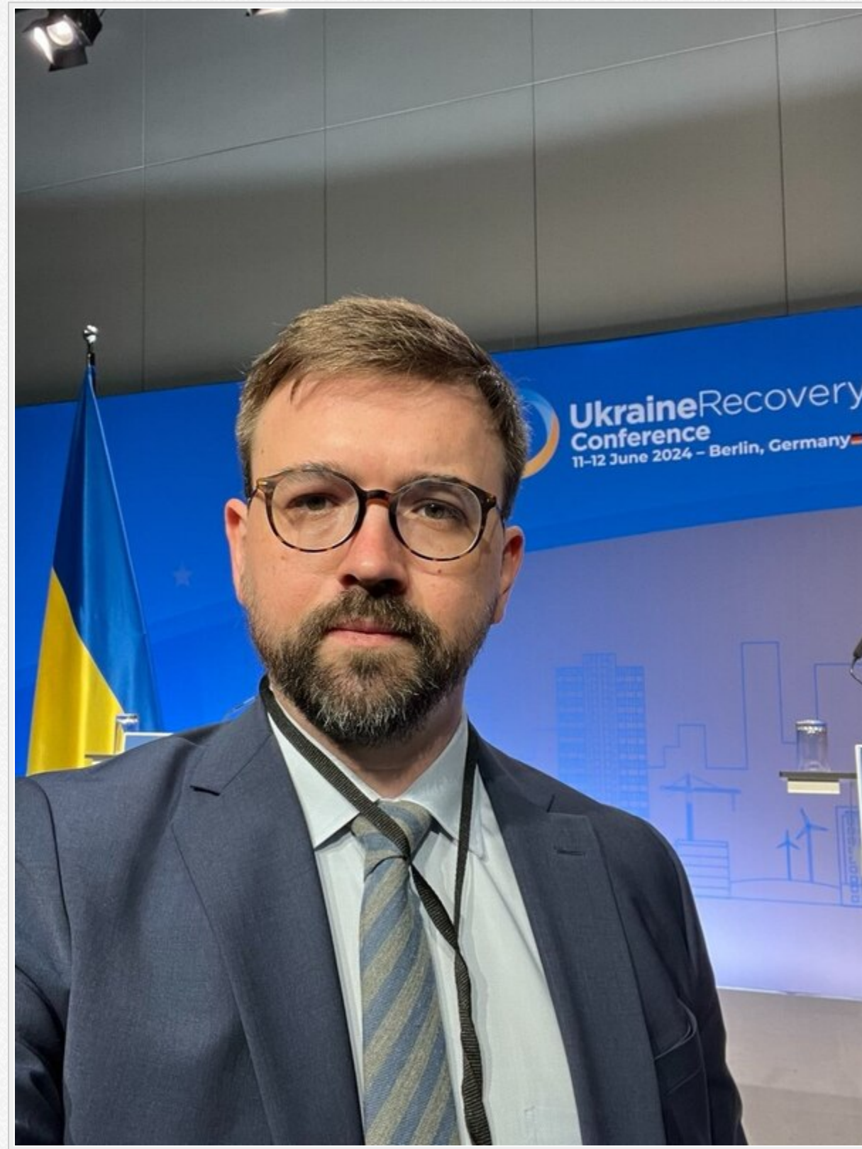
Схема виглядає як класичний приклад тінювого впливу: перебуваючи в наглядовій раді системного оператора, зберігати контроль, кабінет і авто в розподільчих мережах під прикриттям статусу радника міністра та водночас спрямовувати державні підприємства до спілки свого соратника.

Тієї самої, яку очолює Олександр Баранюк – його давній колега за попереднім складом Наглядової ради «Укренерго».