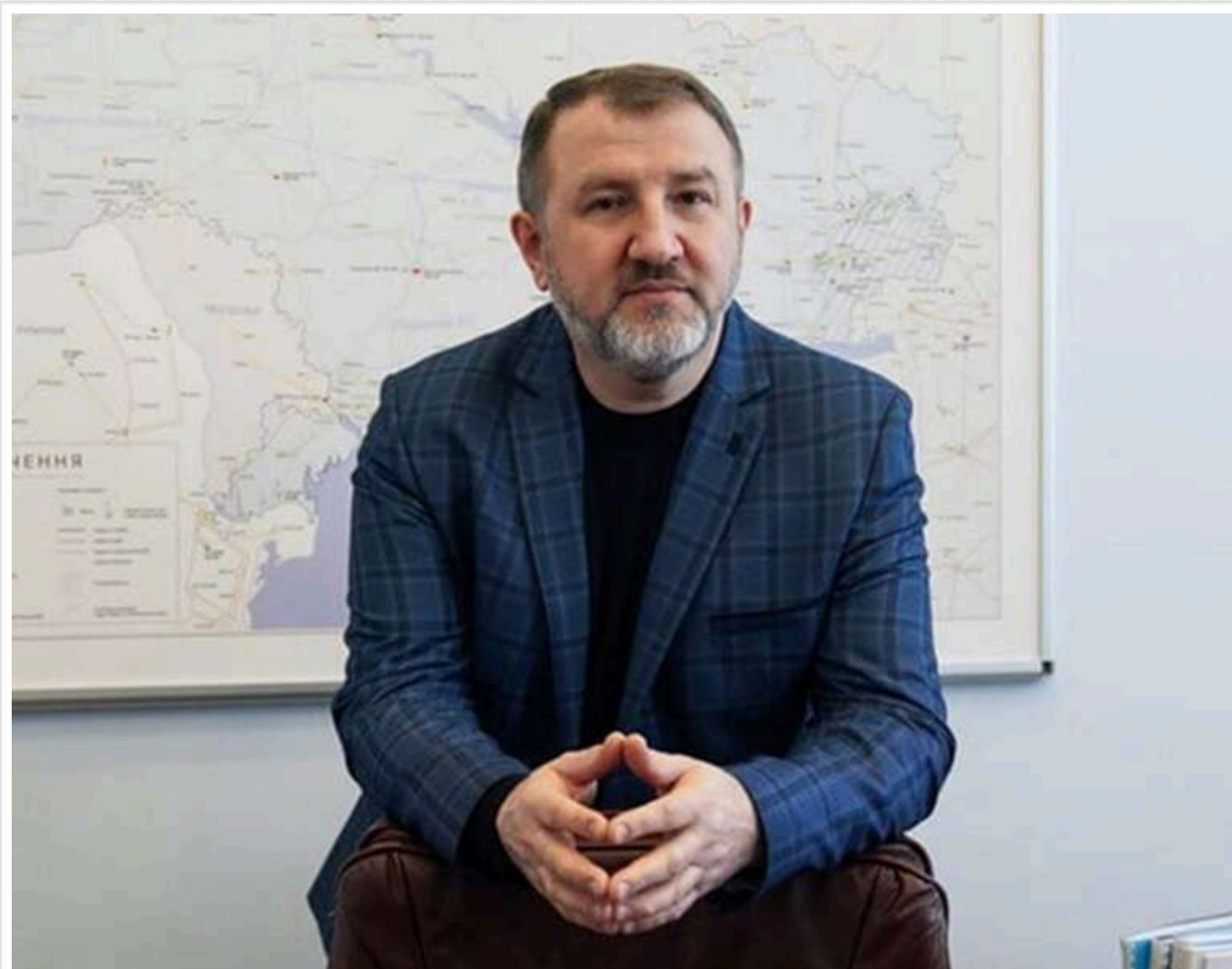
Конфлікт інтересів в енергосекторі: чому радник міністра Юрій Бойко продовжує неофіційно керувати «Українськими розподільними мережами»

Читати на руськом Додати як бажане джерело в Google