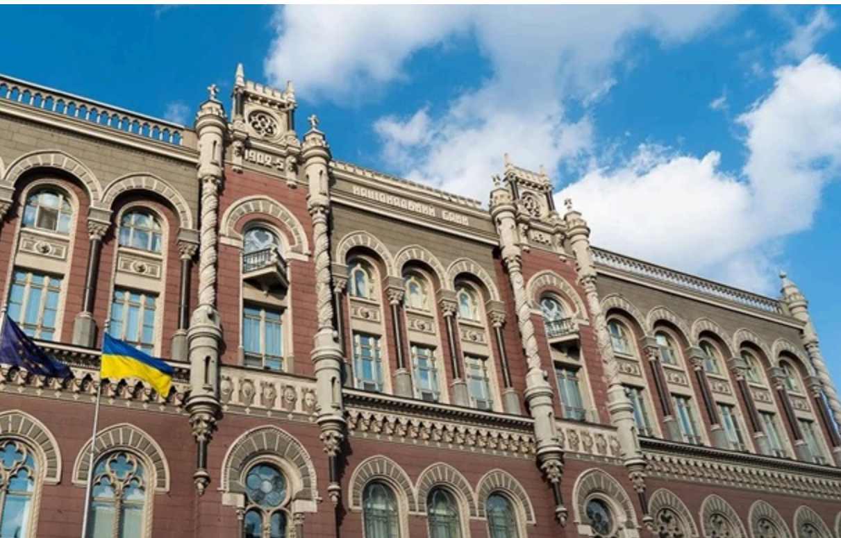
НБУ рекордно підвищив курс долара на 11 червня

На міжбанку американська валюта знову зросла і вперше перевищила психологічну позначку у 45 гривень за долар.