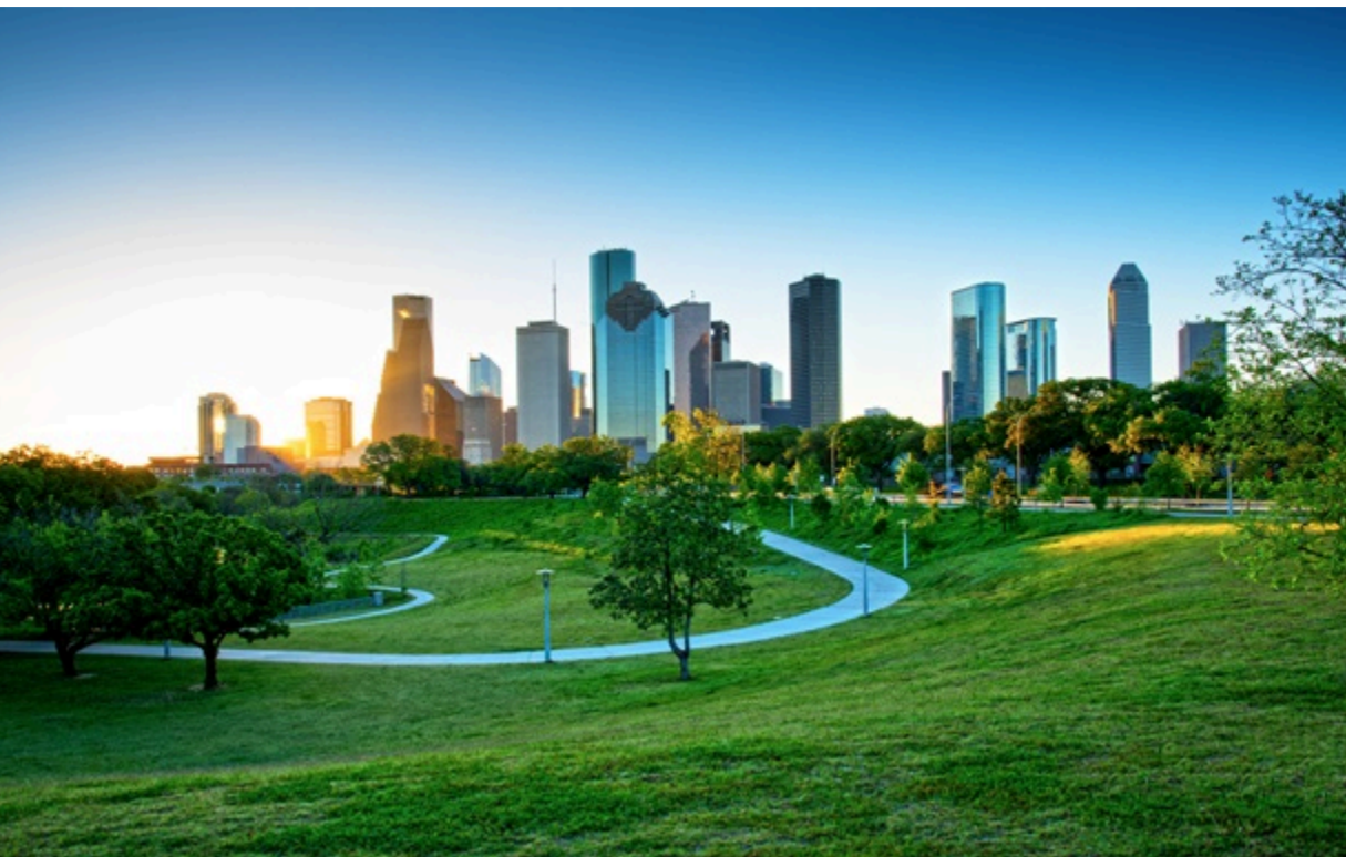
Фермерська земля для парку стала майданчиком для датацентру в США

Фермер передав близько 35 гектарів громаді для створення парку, проте, влада вирішила згодом продати її під будівництво датацентру.