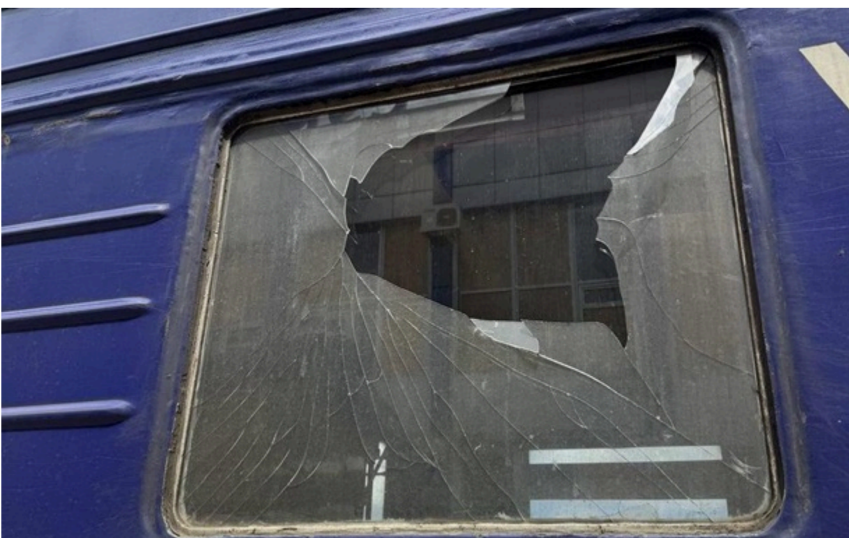
Вибите вікно у потязі в Сумах

Постраждали четверо людей. Їхній стан задовільний. Всі вони отримали медичну допомогу на місці.