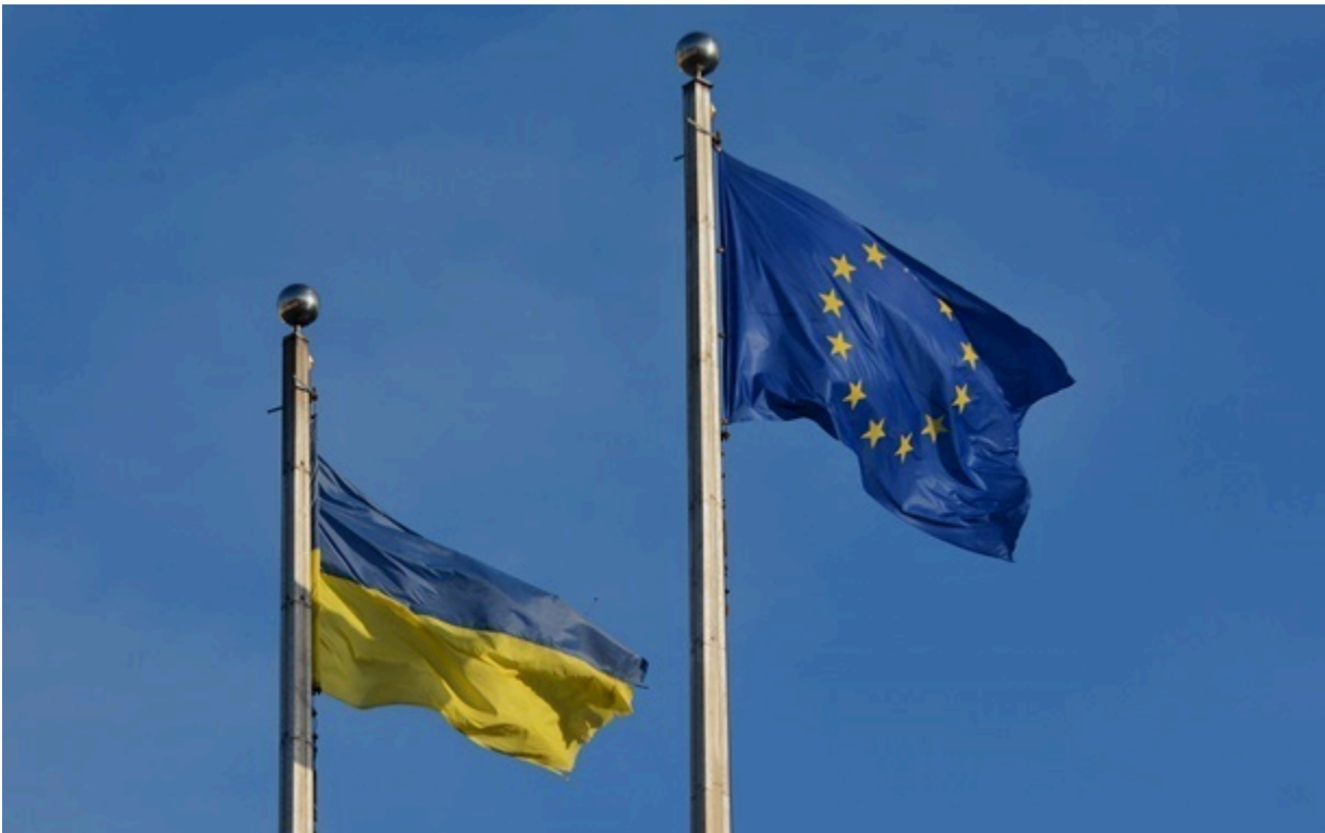
Більшість європейців сприймають Україну як партнера

Польща, Угорщина та Болгарія виявились країнами, де найвища частка відповідей про Україну як конкурента або навіть супротивника (хоча сукупно такі респонденти все одно у меншості).