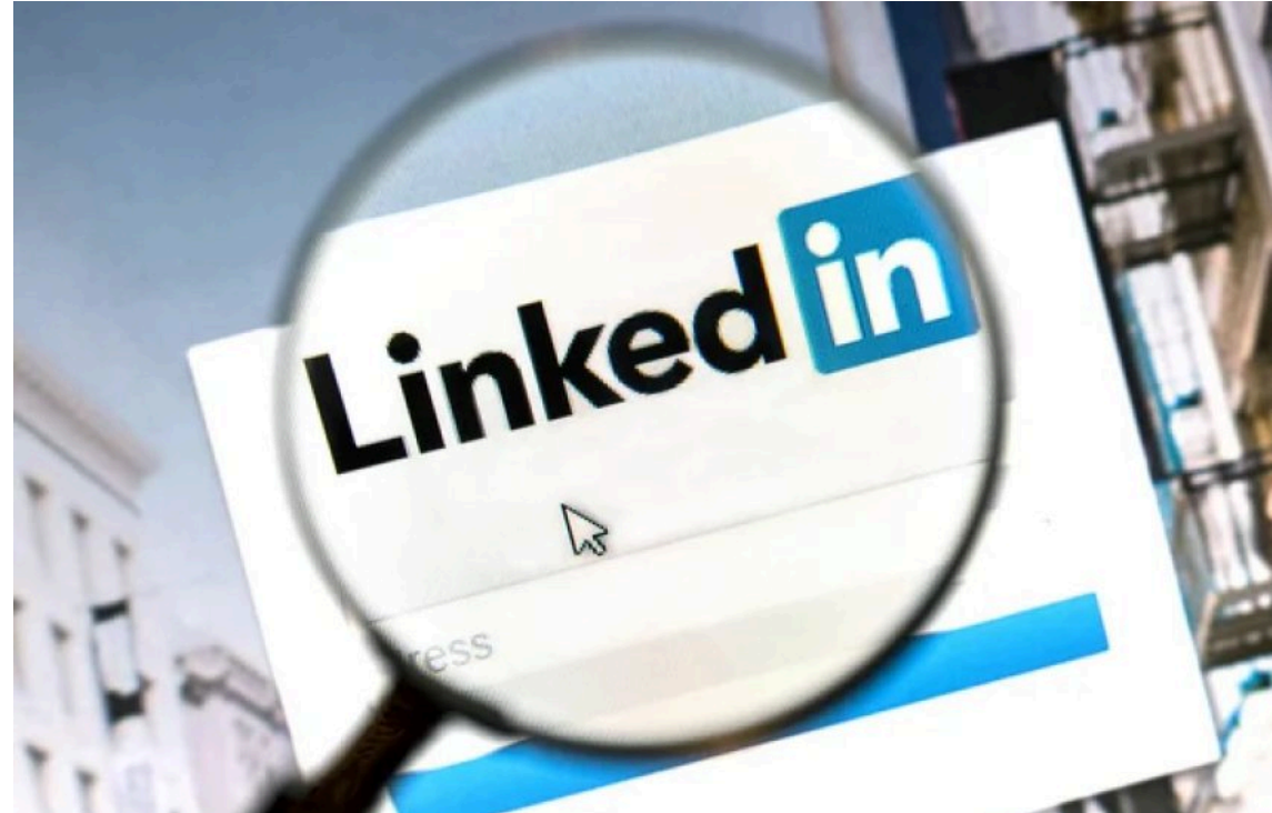
LinkedIn запусає новий рекламний бізнес із доходом 100 мільйонів доларів

Соціальна мережа для пошуку ділових контактів LinkedIn запустила новий масштабний підрозділ під назвою BrandWorks. Нова команда маркетингових експертів допомагатиме великим брендам створювати та запускати ефективніші рекламні кампанії, а керівництво платформи розраховує вийти на виторг в 100 мільйонів доларів на рік уже в наступному фінансовому році.