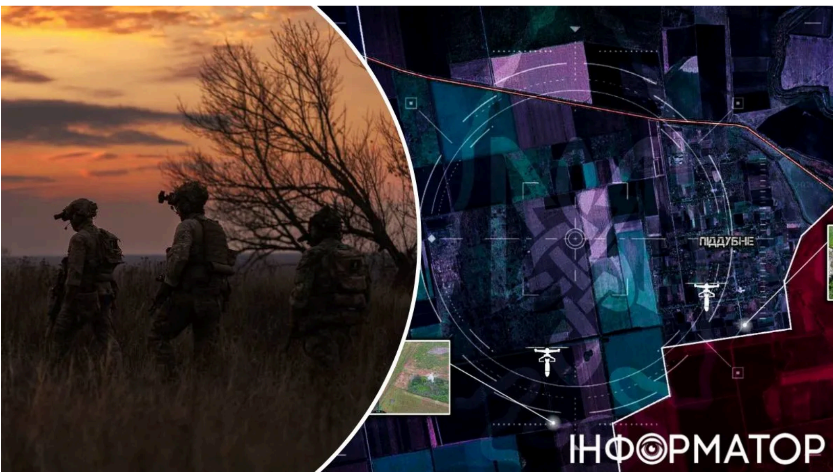
Бої під Покровськом - сіра зона розширюється

На південно-донецькому напрямку навколо Піддубного тривають інтенсивні бойові зіткнення. Суцільної лінії фронту тут фактично немає - контроль над позиціями постійно змінюється залежно від активності штурмових груп. Схожа картина складається й у кількох суміжних населених пунктах, де бойові дії фрагментуються на дрібні осередки.