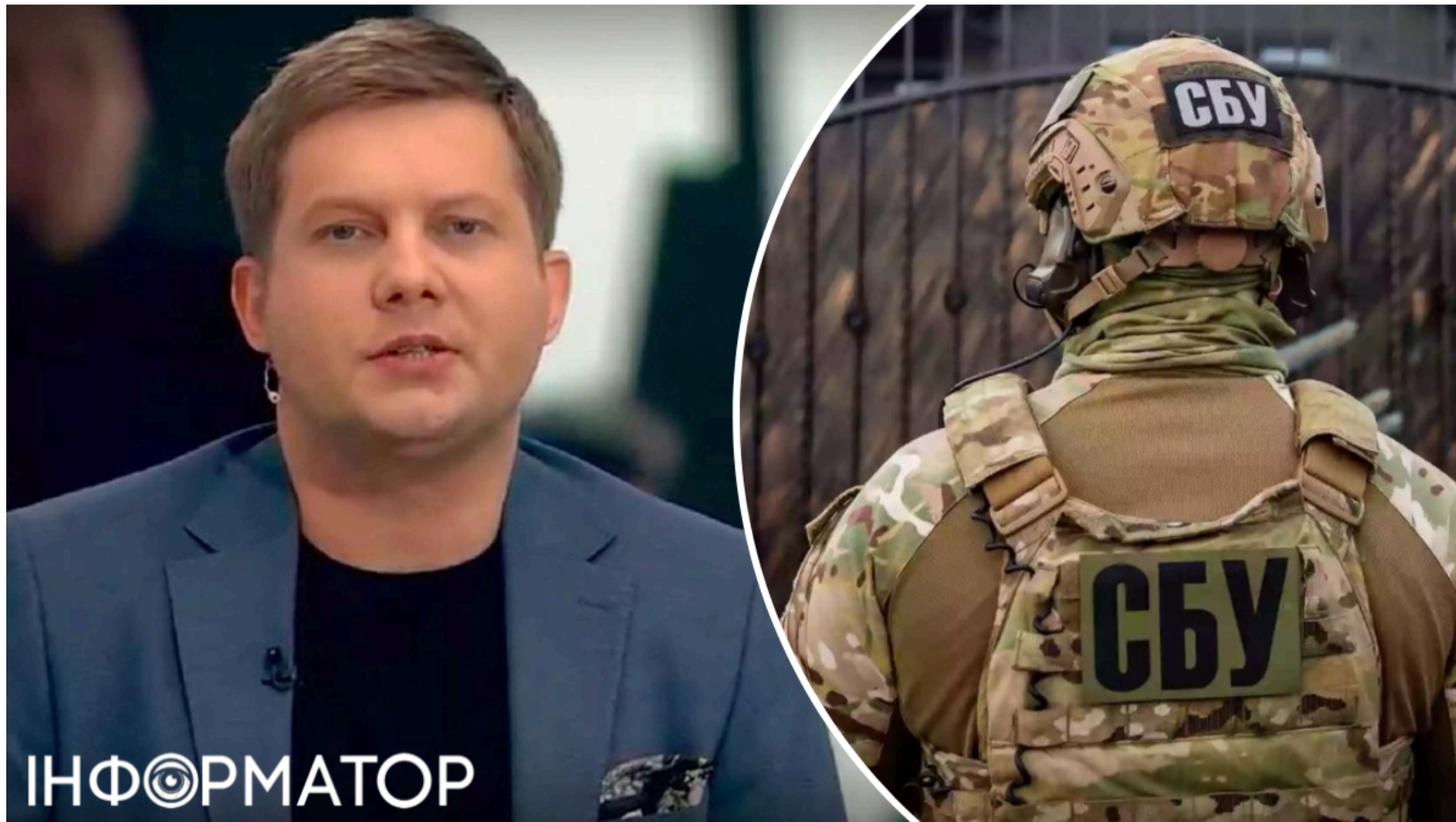
Актор-пропагандист Корчевніков постане перед судом.

Колишній актор серіалу "Кадети" і нинішній керівник кремлівського телеканалу "Спас" Борис Корчевніков став фігурантом кримінального провадження в Україні. СБУ завершила досудове розслідування і передала справу до суду. Корчевнікову інкримінують три статті Кримінального кодексу: від посягання на територіальну цілісність України до незаконного перетину державного кордону.