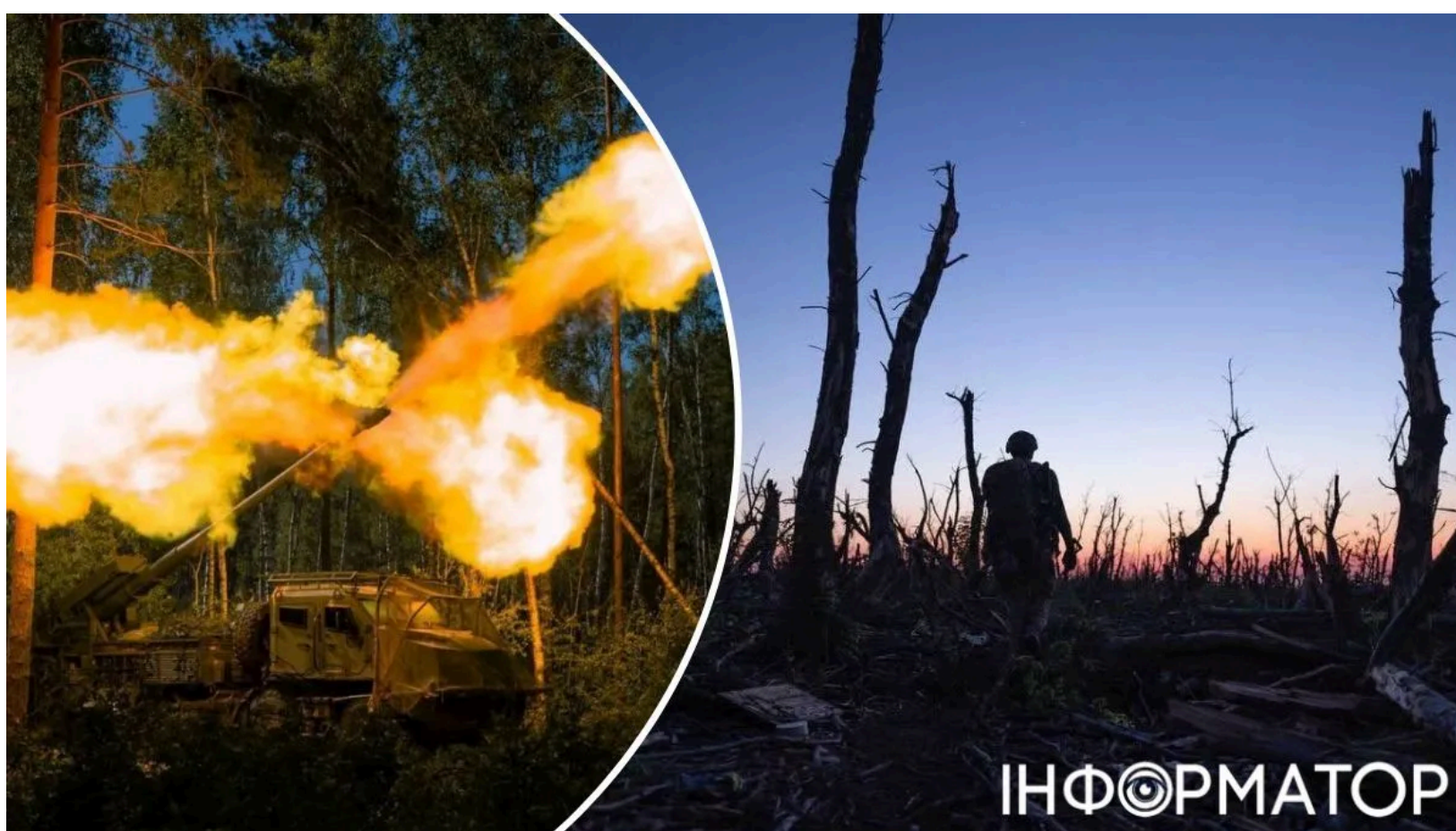
Війна в Україні вже перевершила за масштабами Першу світову