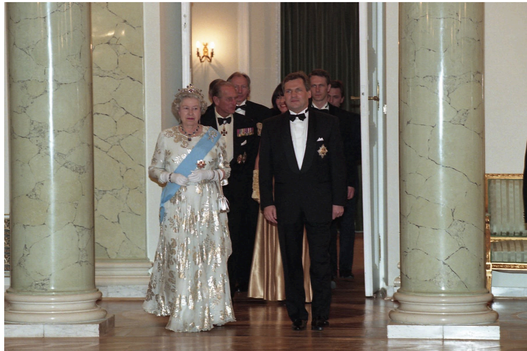
Така нагорода була і у королеви Єлизавети Другої.

Окрім Володимира Зеленського, кавалерами ордена Білого Орла також були українські президенти Леонід Кравчук, Леонід Кучма, Віктор Ющенко та Петро Порошенко. Тобто 5 із 6 українських президентів.