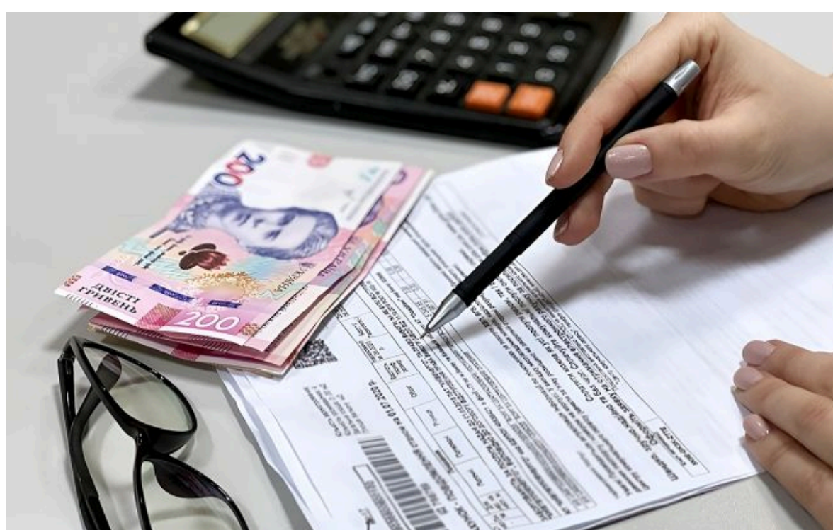
Фото: субсидії та пільги на оплату житлово-комунальних послуг (if.gov.ua)