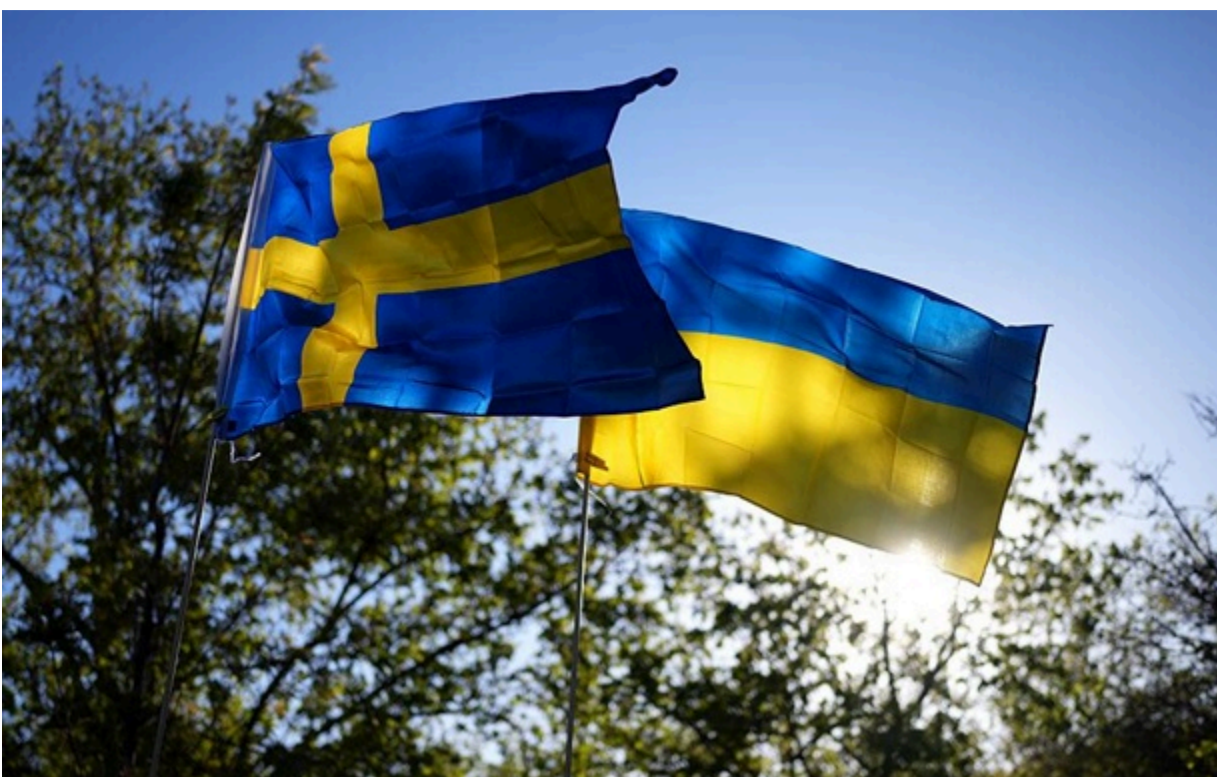
Швеція надала фінансову допомогу Україні

Гроші надано Міжнародним банком реконструкції та розвитку під гарантію уряду Швеції. Вони будуть спрямовані на фінансування соціальних витатків.