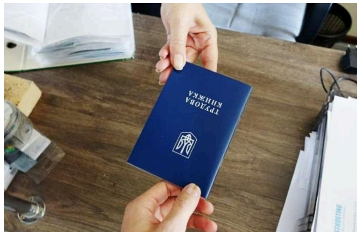
Оцифрування трудових книжок продовжиться після 10 червня

Процес оцифрування трудових книжок в Україні продовжиться і після 10 червня 2026 року, а паперові документи й надалі підтверджуватимуть стаж українців.