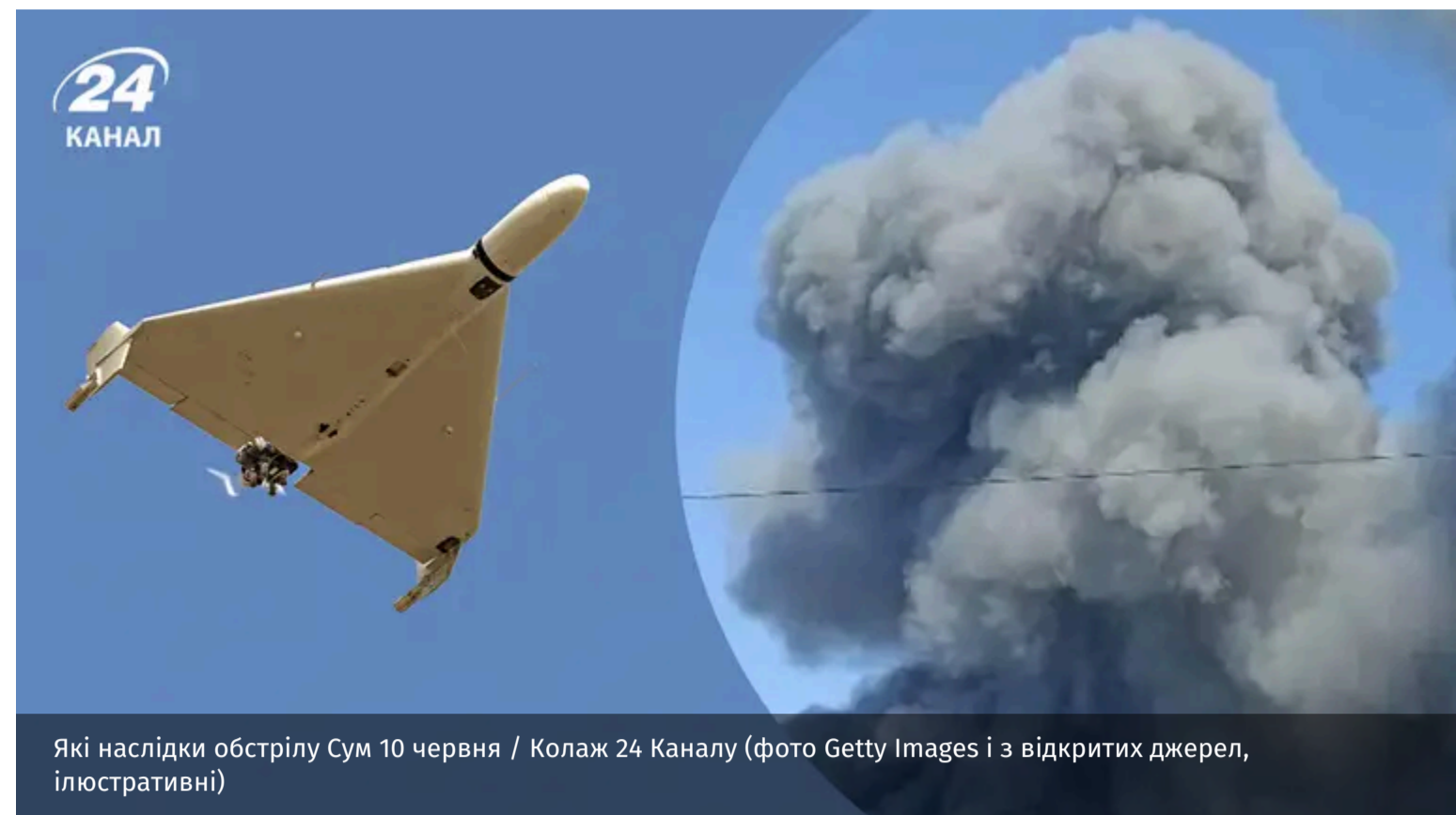
Які наслідки обстрілу Сум 10 червня / Колаж 24 Каналу (фото Getty Images і з відкритих джерел, ілюстративні)

Російська армія 10 червня обстріляла Суми безпілотниками. Внаслідок цього є влучання на об'єкті транспортної інфраструктури.