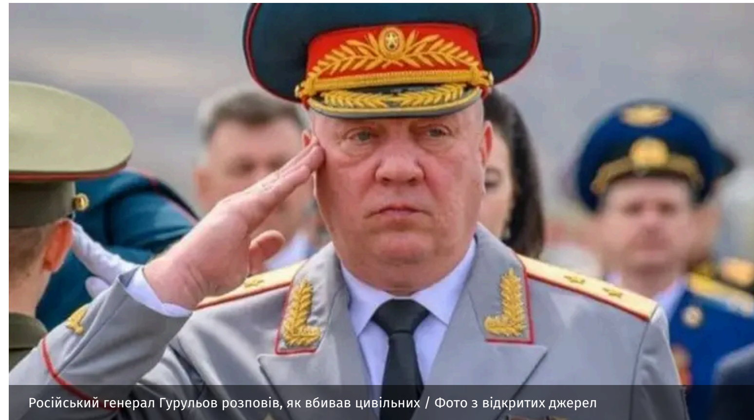
Російський генерал Гурульов розповів, як вбивав цивільних

Російський генерал Андрій Гурульов розповів, як у 2014 році вбивав мирне населення. Військовий давно відомий тим, що командував окупаційними військами на Донбасі.